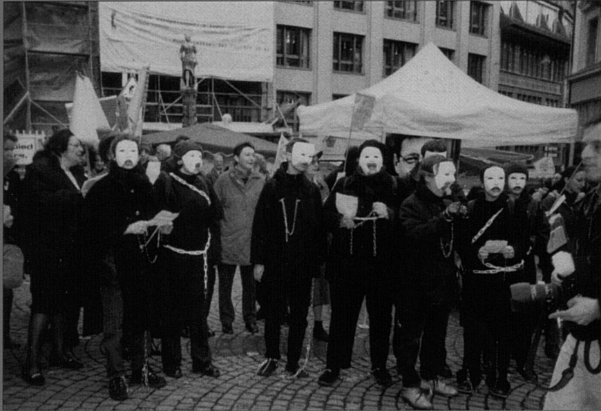
Le 4 mars 2000 à Lausanne: action de rue dénonçant les violences faites aux femmes, organisée par diverses associations féministes dans le cadre de la Marche mondiale des femmes.