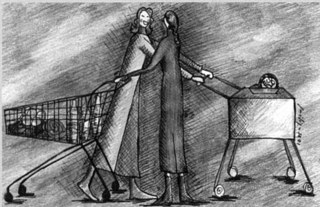
illus: Emilija Karamata