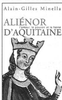
Alain-Gilles Minella Aliénor d'Aquitaine Perrin, 2004/343 pages/Fr. 43.40

L'auteur s'attaque ici, avec sa précision chirurgicale, à une icône du Haut Moyen-Age. En journaliste plutôt qu'en historien, il mène l'enquête à travers les arcanes de la féodalité, les hasards des successions, des mariages, des conquêtes et des intrigues de Cour. Curieux du moindre détail, il se livre à une compilation minutieuse des nombreux ouvrages consa-