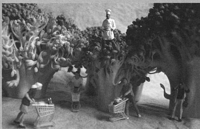
« pâtes aux brocolis et à la spiruline » de Sylvain Fournier