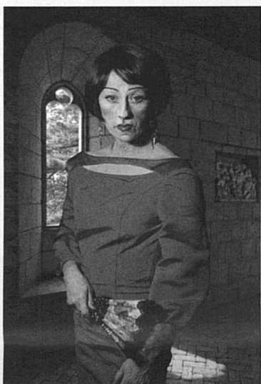
Cindy Sherman, untitled

La société assigne un rôle aux femmes et une utilité : la reproduction et les tâches qui s'y rapportent, que ce soit dans la sphère privée ou professionnelle. Après 40 ans environ, les femmes deviennent inutiles. Rester jeunes, du moins en apparence, entretient l'idée qu'elles peuvent avoir une place dans la société. Fiction ou réalité?