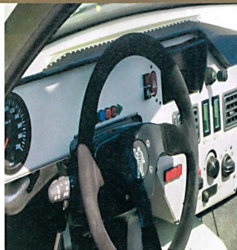
Blick ins Cockpit des HY-LIGHT, den das PSI entwickelt hat.