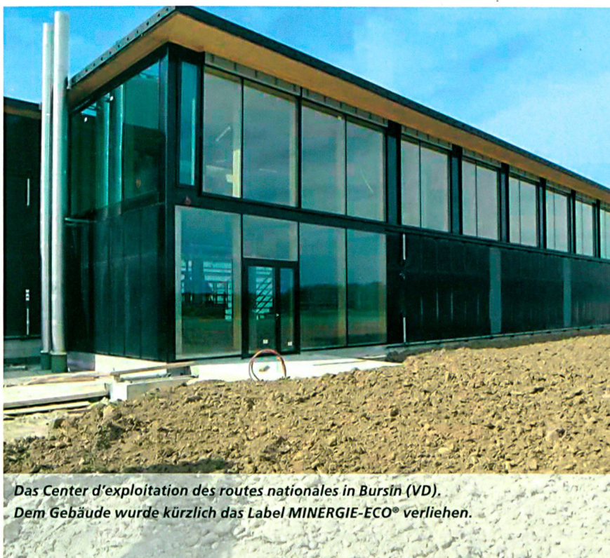
Das Center d'exploitation des routes nationales in Bursin (VD). Dem Gebäude wurde kürzlich das Label MINERGIE-ECO® verliehen.