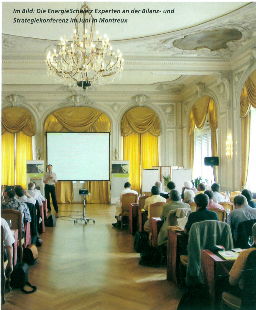
Im Bild: Die EnergieSchweiz Experten an der Bilanz- und Strategiekonferenz im Juni in Montreux

www.bfe.admin.ch/energie/00458/00595/index.html?lang=de