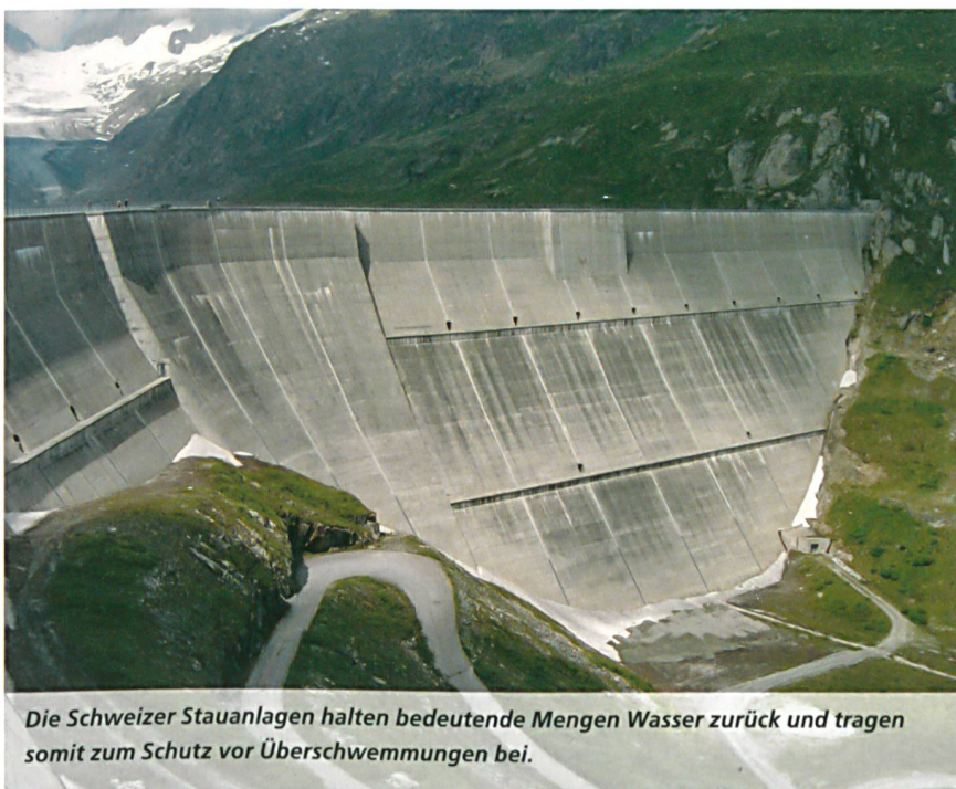
Die Schweizer Stauanlagen halten bedeutende Mengen Wasser zurück und tragen somit zum Schutz vor Überschwemmungen bei.