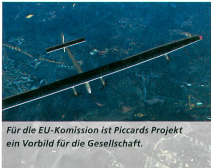
Für die EU-Kommission ist Piccards Projekt ein Vorbild für die Gesellschaft.

Der Westschweizer Flugpionier Bertrand Piccard erhält gewichtige Unterstützung: Die EU-Kommission hat Piccards Flugprojekt «Solar Impulse» am 9. April die Patenschaft zugesichert. «Das Projekt ist ein Vorbild für unsere Gesellschaft, ein Symbol für das, was wir erreichen müssen», wird EU-Verkehrskommissar Jacques Barrot in einer Mitteilung zitiert. In einer von fossilen Energien