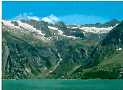
Strom aus Pumpspeicherkraftwerken darf nicht in seiner Ganzheit mit der Qualität «Wasserkraft» versehen werden.

Um Strom in grossem Masse speichern zu können, wird in Schweizer Wasserkraftanlagen Strom in Zeiten mit niedriger Nachfrage auf den internationalen Märkten eingekauft, um Wasser aus tiefer liegenden Becken in höher gelegene Speicherseen pumpen zu können. Dieses gespeicherte Wasser kann dann während Nachfragespitzen wieder in Strom zurückverwandelt beziehungsweise turbinieren werden. Dieser Strom darf jedoch