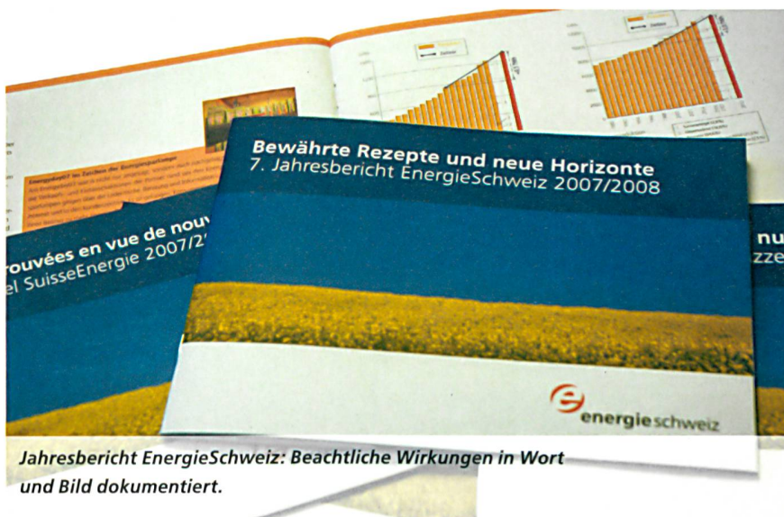
Jahresbericht EnergieSchweiz: Beachtliche Wirkungen in Wort und Bild dokumentiert.