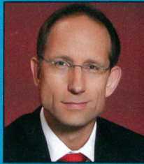
Reto Brennwald Moderator Schweizer Fernsehen