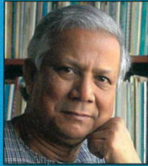
Muhammad Yunus Friedensnobelpreisträger Gründer Grameen Bank