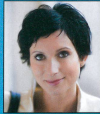
P. Bruderer Wyss Nationalratspräsidentin und Unternehmerin