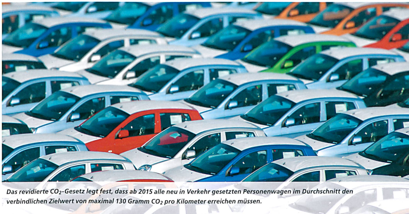
Das revidierte CO 2 -Gesetz legt fest, dass ab 2015 alle neu in Verkehr gesetzten Personenwagen im Durchschnitt den verbindlichen Zielwert von maximal 130 Gramm CO 2 pro Kilometer erreichen müssen.