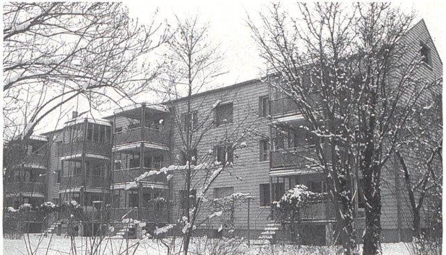
Exemple de rénovation judicieuse de bâtiments construits dans les années 60 (Soleure).