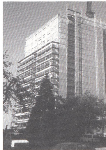
L'immeuble en cours de rénovation, avec ses échafaudages.

Pour en savoir plus, visitez les stands "Village de l'Energie" et "Pro Renova". Exposition "Habitat & Jardin", halle 15, du 1 er au 9 mars 1997, au Palais de Beaulieu, Lausanne.