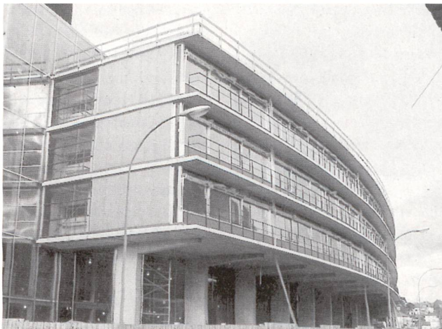
A Neuchâtel, l'Office fédéral de la statistique, construit selon les principes du développement durable, possède la plus grande surface de capteurs solaires thermiques en Suisse.