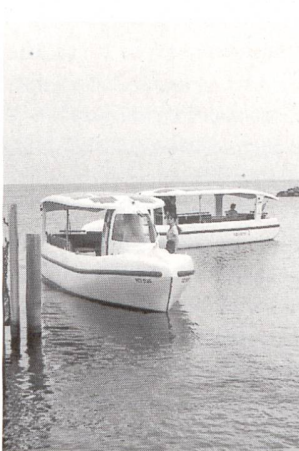
Entre St-Sulpice et Lutry, au bord du lac Léman, deux navettes électrosolaires, Aquarel I et II, assurent les liaisons lacustres.