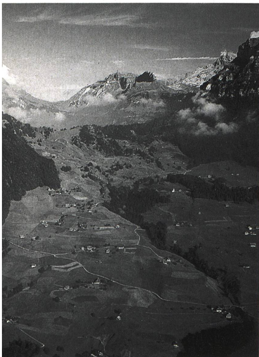
Vue Sud-Ouest du Wellenberg

La GNW et la NAGRA, son centre de compétences techniques, ont adapté le projet Wellenberg selon les exigences du KFW, et présenté à fin novembre 2000 dans le rapport