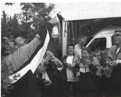
Le champagne est sabré pour fêter dignement le 29 e rang (sur 187 équipes participantes).