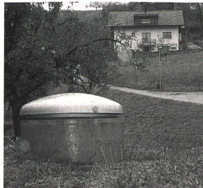
Münsingen, Cité de l'énergie, a réalisé des économies substantielles grâce à un paquet de mesures dans l'approvisionnement en eau potable.

Exemple à Münsingen. Ces trois études de cas ont fait l'objet d'une brochure et, fin juin, d'une conférence à Berne. Près de 60 participants ont alors visité le service d'approvisionnement en eau de Münsingen (Cité de l'énergie). Les fuites y ont diminué de deux tiers ces dernières années, tandis que des pompes à bon rendement et une installation hydroélectrique alimentée à l'eau potable ont été mises en service.