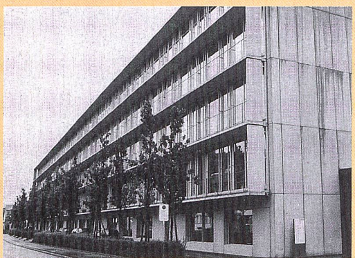
Adliswil: MINERGIE record grâce à Swiss Re

■ VEL 2 a généré un projet censé promouvoir la mobilité douce (piétons et deux-roues) et intitulé «Mendrisio dans l'air du temps». L'objectif consiste à sensibiliser les piétons et les cyclistes afin qu'ils prennent conscience du temps qu'il leur faut pour atteindre les sites les plus importants de la commune.