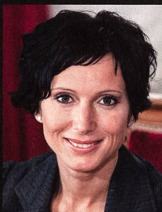
PASCALE BRUDERER, CONSEILLÈRE NATIONALE ET MEMBRE DU JURY DU WATT D'OR.

«LE WATT D'OR PERMET DE METTRE EN ÉVIDENCE DES PROJETS ÉNERGÉTIQUES EXEMPLAIRES OU FUTURISTES. CEUX-CI PRÉFIGURENT LE QUOTIDIEN DE DEMAIN ET L'AVENIR ÉNERGÉTIQUE DU PAYS.»