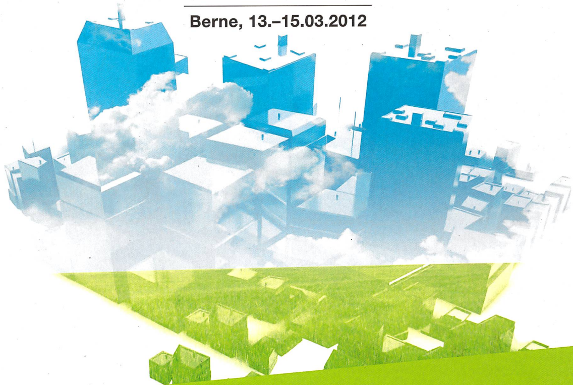
Plate-forme pour le développement durable des communes, des villes et des entreprises