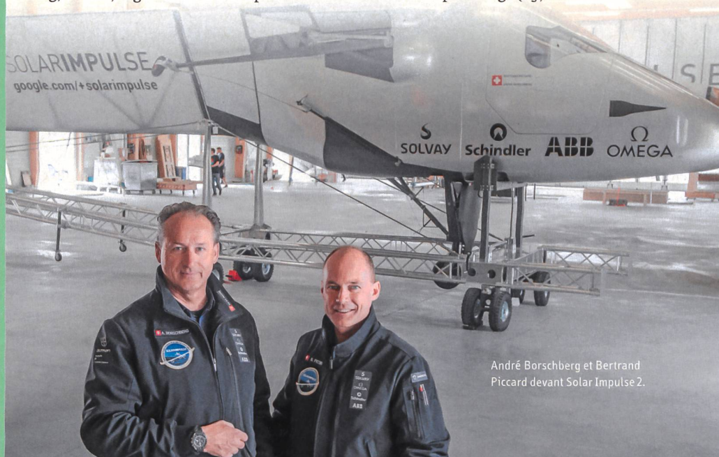
André Borschberg et Bertrand Piccard devant Solar Impulse 2.

Au cours des onze étapes prévues pour ce tour du monde, l'avion devrait se déplacer à une vitesse comprise entre 36 km/h au-dessus de la mer et 140 km/h à 8500 m d'altitude. Il est possible de suivre l'évolution de ce tour du monde sur le site internet www.solarimpulse.org . (luf)