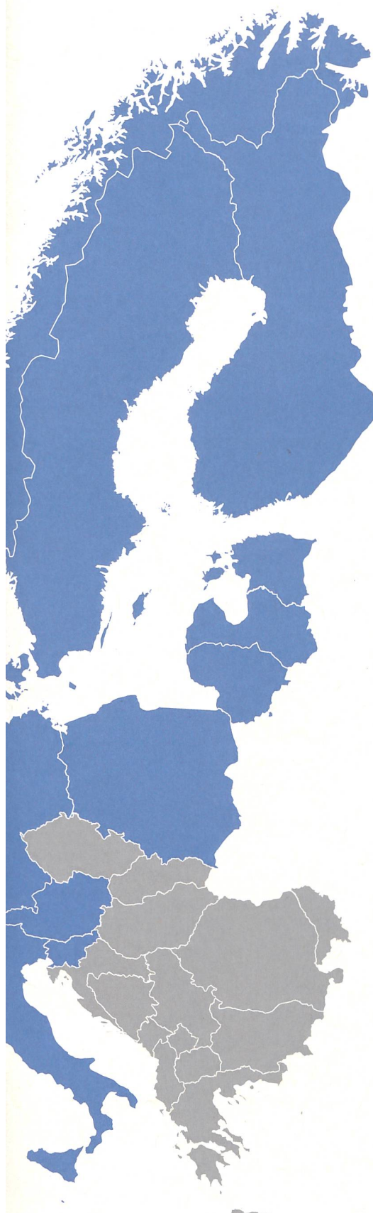
Le couplage des marchés permet de connecter la Suisse avec 19 pays.