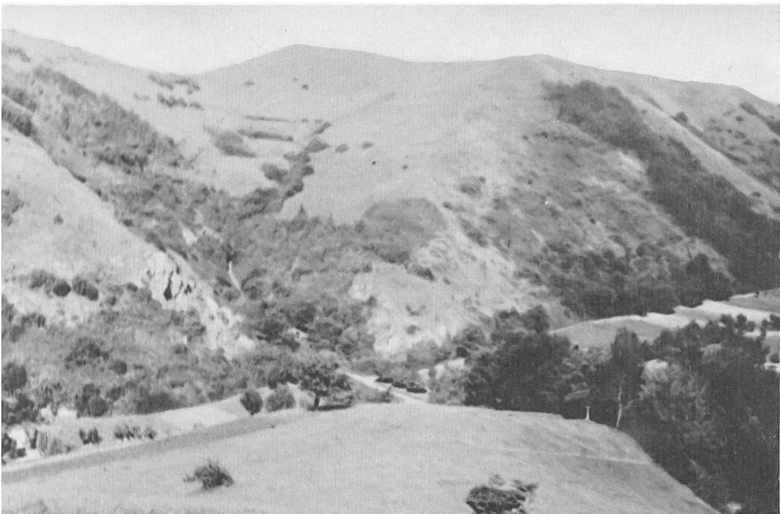
Das "Badloch" am Badberg.