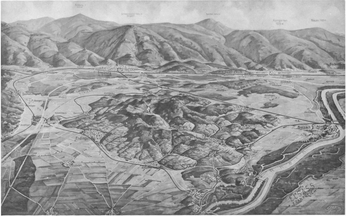
UEBERSICHT- und RELIEFKARTE VOM KAISERSTUHL (mit Genehmigung der Verlagsanstalt M. Wittkop GmbH/F. Bruckmann KG, München)