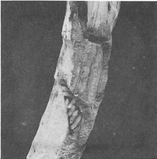
Puppenwiege von Agrilus integerrimus Ratz. angefüllt mit Puppen der Erzwespe Tetrastichus heeringi Delucchi.