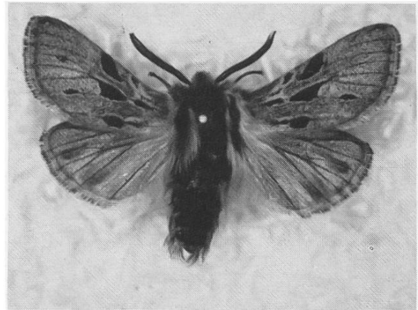
Abb. 3. O. parasita lianea WITT : Männchen mit reduzierten Flecken