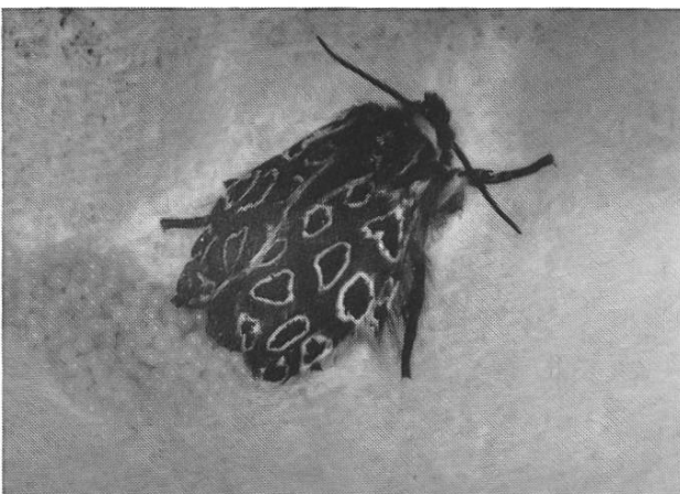
Abb. 1. Eiablage von O. parasita lianea WITT. Die Flecken auf der Vfl.O. sind bei dieser Unterart deutlich hell umrandet.

Die Eier sind blass gelblichgrün und werden haufenförmig abgelegt. Ein Gelege enthält etwa 400 Eier. Es ist sehr erstaunlich, dass die Eier der spp. lianea im Vergleich mit denjenigen aus dem Wallis und Tessin deutlich kleiner sind.