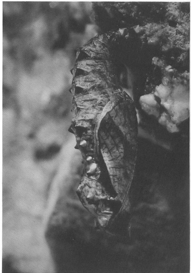
Abb. 3 u. 4: Rücken- und Seitenansicht der Puppe.