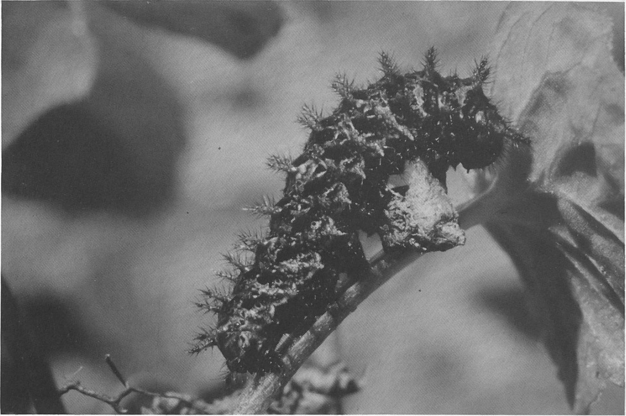
Abb. 2-4. Die ersten Stände von Clossiana thore . Abb. 2: Ausgewachsene Raupe.