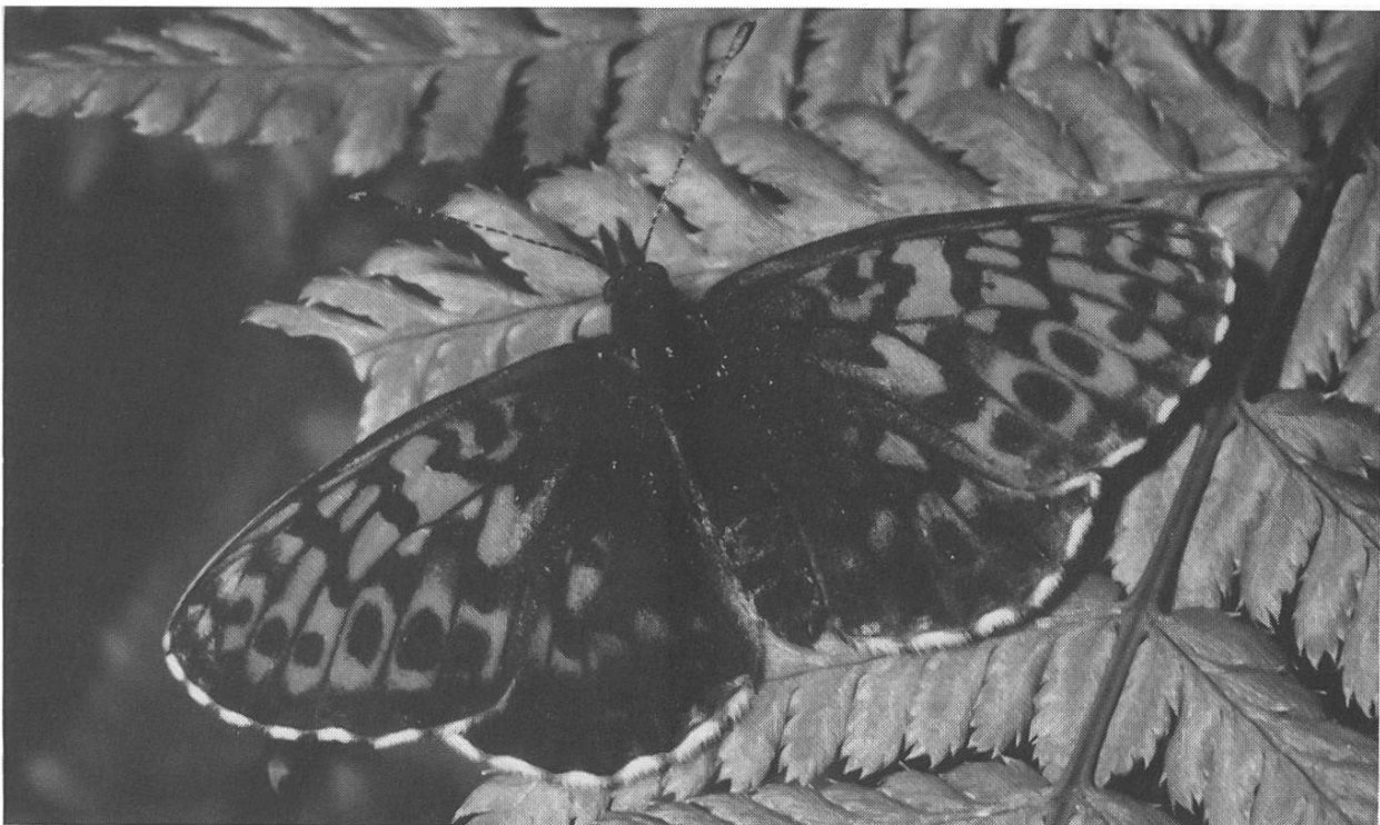
Abb. 1. Bergveilchenperlmutterfalter ( Clossiana thore ) auf Farn sitzend. Ich konnte das Saugen an Blüten bisher nicht beobachten.