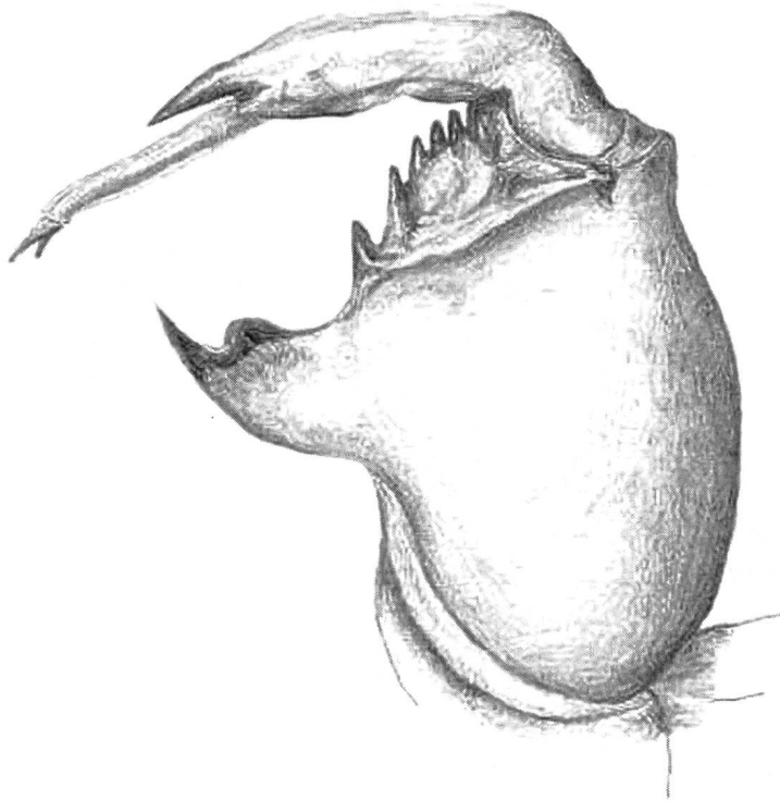
Abb. 3. Linkes Vorderbein der Exuvien vom Fricktaler Fundort mit als Grabbein stark ausdifferenzierter Tibia und Femur (Zeichnung Autor).

Die Singzikadenpopulation weist eine hohe Individuendichte auf. Die singenden Männchen sitzen normalerweise mehrere Meter über Boden an Föhren, oft nur unweit von benachbarten Männchen entfernt. Die Individuen sind scheu und hervorragend getarnt. Der Gesang ist schwierig zu orten und wird bei Annäherung rasch eingestellt. Der Fang von Adulttieren misslang an allen Feldtagen. Hingegen konnten drei Exuvien (1 ♀, 2 ♂♂) gefunden werden. Diese wurden auf wenigen m 2 an Grashalmen gesammelt. Ihre Morphologie ähnelt derjenigen von Cicadetta montana sehr (vgl. Abb. 3).