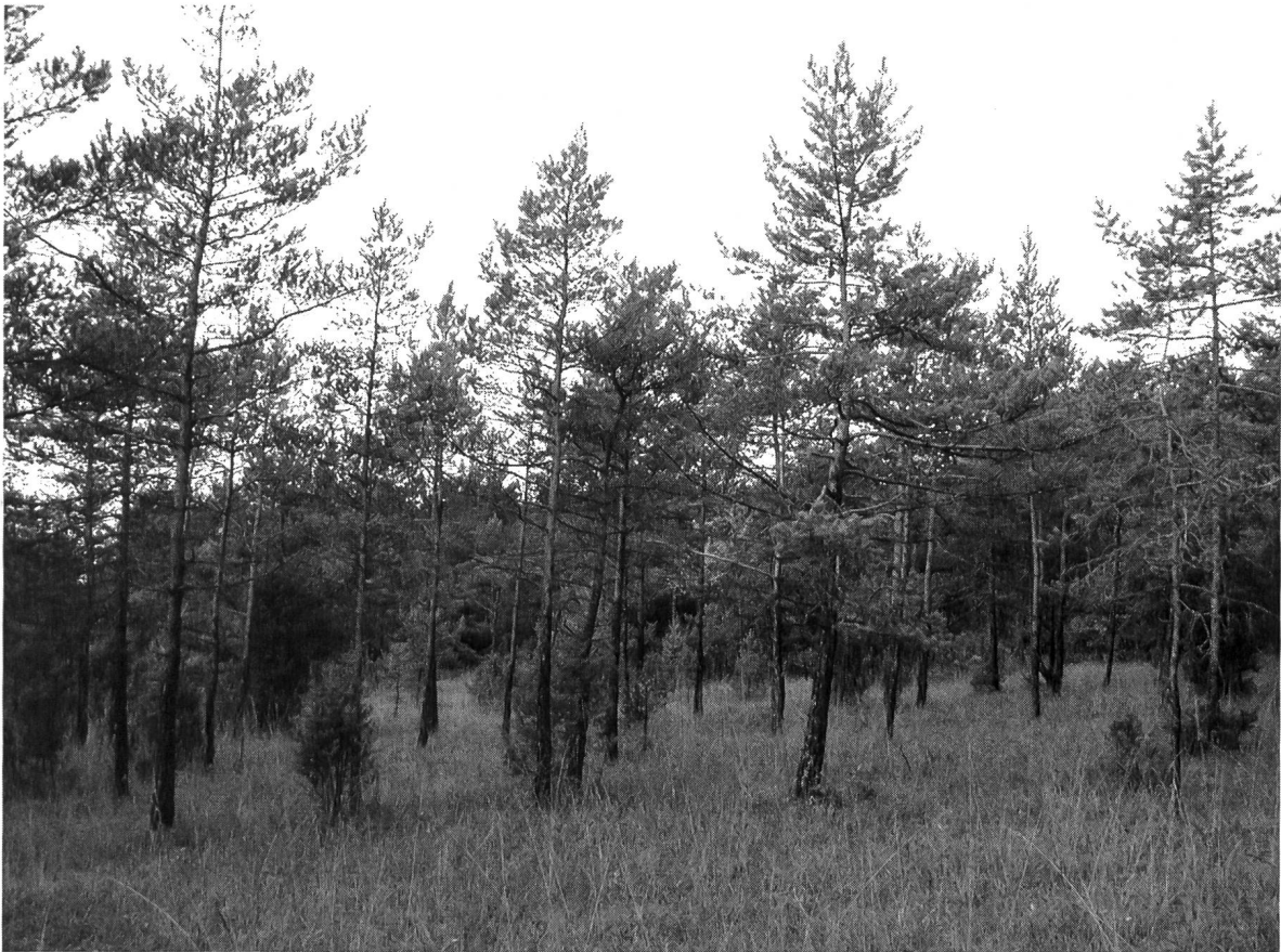
Abb. 2. Pfeifengras-Föhrenwald, Lebensraum von Cicadetta sp. im Fricktal.

Pause. Die Gesangspausen sind in Abb. 1 aufgrund von Eigenrauschen des Aufnahmegerätes nicht deutlich ersichtlich. Lautmalerisch könnte man den Gesang mit „sssssupp-sssssupp-sssssupp“ umschreiben. Das Ticken ist deutlich lauter als der Summlaut. Ein Element ist meist zwischen 0,6-0,9 s lang. Die Länge der Strophe variiert stark und hält oft über 20 s an. Der Hauptfrequenzbereich des Gesangs liegt nahe der hörbaren oberen Grenze. Die besten Aufnahmen gelangen bei Einstellung des Ultraschalldetektors auf 19 kHz, obwohl der Gesang einen tieferen Hauptfrequenzbereich aufweisen dürfte. Die Lautäusserungen sind für Menschen mit gutem Gehör ohne Hilfsmittel aus zehn Metern Entfernung wahrnehmbar. Zwanzig bis vierzig Männchen konnten beim Partnergesang akustisch festgestellt werden.