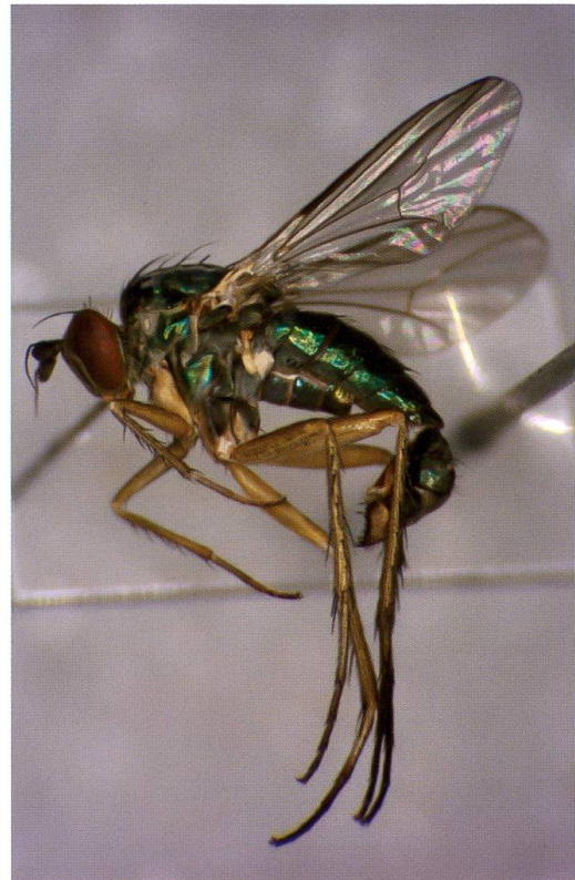
Abb. 3: Hercostomus gracilis (Stannius, 1831). Leuk-Platten, 3.VIII.1998.

Funddaten: AG, Aristau VI.-VIII.1975, leg. E. Wunderlich. TI, Piotta, 19.-22.VIII.1981. TI, Bellinzona, 26.-30.VIII.1981. ZH, Dietikon, 3.-10.VIII.1984, 24.-28.VII.1987, 20.VII.1989, 5.VIII.1989, 19.-23.VII.1990, 18.-22.VII.1991, 16.-20.7.1992, 14.-18.