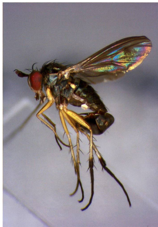
Abb. 2: Hercostomus chaerophylli (Meigen, 1824). Val Bavona, 27.VII.1997.