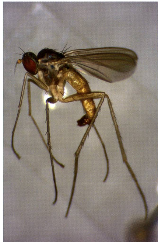
Abb. 4: Neurigona abdominalis (Fallén, 1823). Würenlingen, 6.-11.VI.1973.