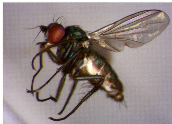
Abb. 1: Asyndetus varus (Loew, 1869). Biasca, 17.VI.1995.

Verbreitung: Mittel- Nord- und Osteuropa.