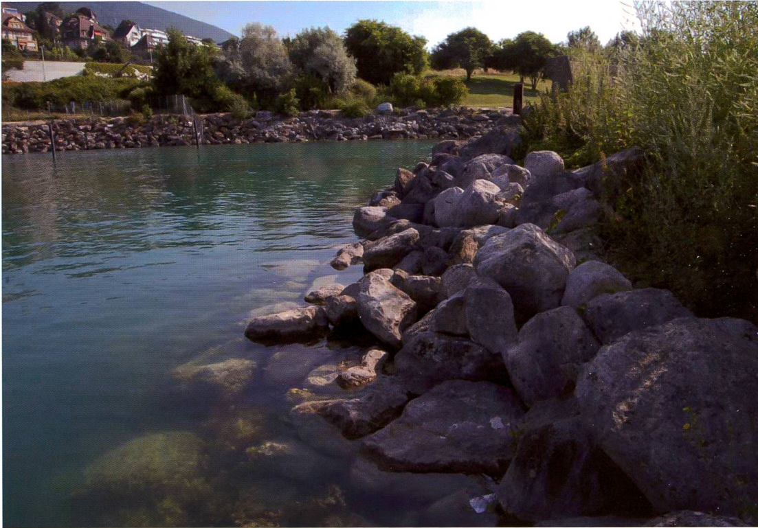
Fig. 4. Quelques exuvies d' Onychogomphus forcipatus et de Somatochlora metallica ont été récoltées le long de la digue fermant le Port du Nid du Crô.