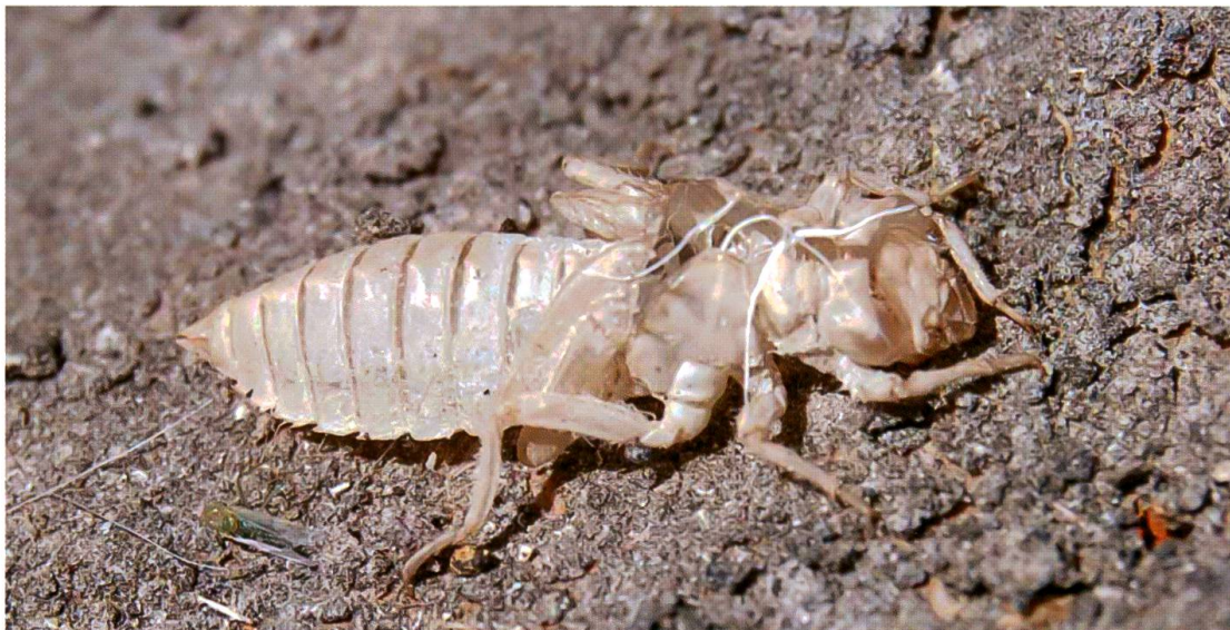
Fig. 1. Exuvie d' Onychogomphus forcipatus reconnaissable aux petites épines latérales des segments 6 à 9 ainsi qu'aux légères protubérances dorsales sur les segments 2 à 9.

Les exuvies sont assez difficiles à trouver et peuvent échapper à l'observation. Par contre, l'envol des imagos et la présence d'ailes d'individus pris après l'éclosion dans les toiles d'araignées sont bien visibles dans un terrain fait d'enrochements massifs et de pelouses. L'exuvie d' O. forcipatus est identifiée par les légères protubérances distales portées par les tergites 2 à 9, ainsi que par les épines latérales des segments 6 à 9 (Fig. 1). Les mâles portent sur les sternites 2 et 3 la marque du futur appareil reproducteur, notamment une fine cicatrice bien délimitée à la base du segment 3.