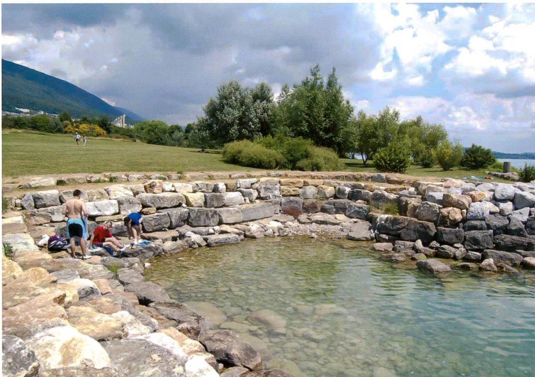
Fig. 3. Crique à fond caillouteux dépourvue de tapis d'algues. La présence de personnes ne semble par compromettre la survie des larves ou le succès des éclosions qui se déroulent en majorité avant que les baigneurs ne se mettent à l'eau.