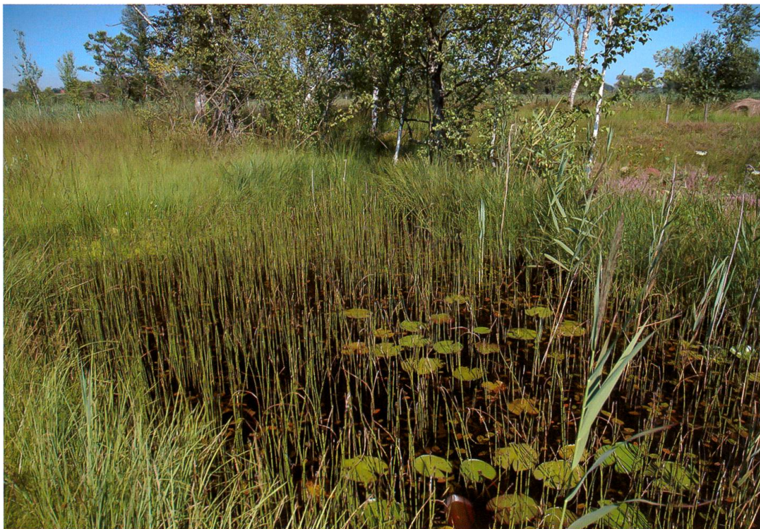
Fig. 8. Ancienne fosse d'exploitation de la tourbe régénérée et offrant des habitats favorables à Ilybius aenescens , I. guttiger , Bidessus grossepunctatus , Rhantus grapii et Hydroporus obscurus . Robenhuserriet, Wetzikon, 26.7.2007.