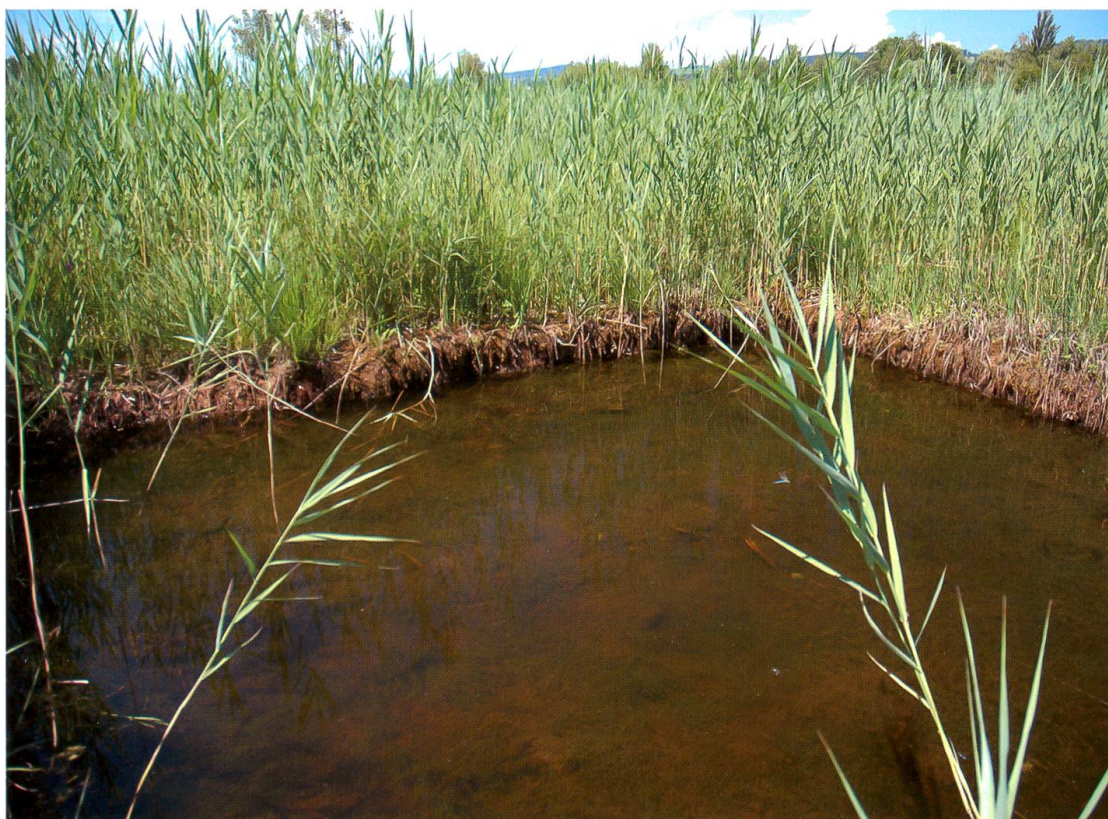
Fig. 9. Illustration de l'aspect d'un étang une année après son creusement. Le fond est couvert de characées. Robenhuserriet, Wetzikon, 2.7.2008.