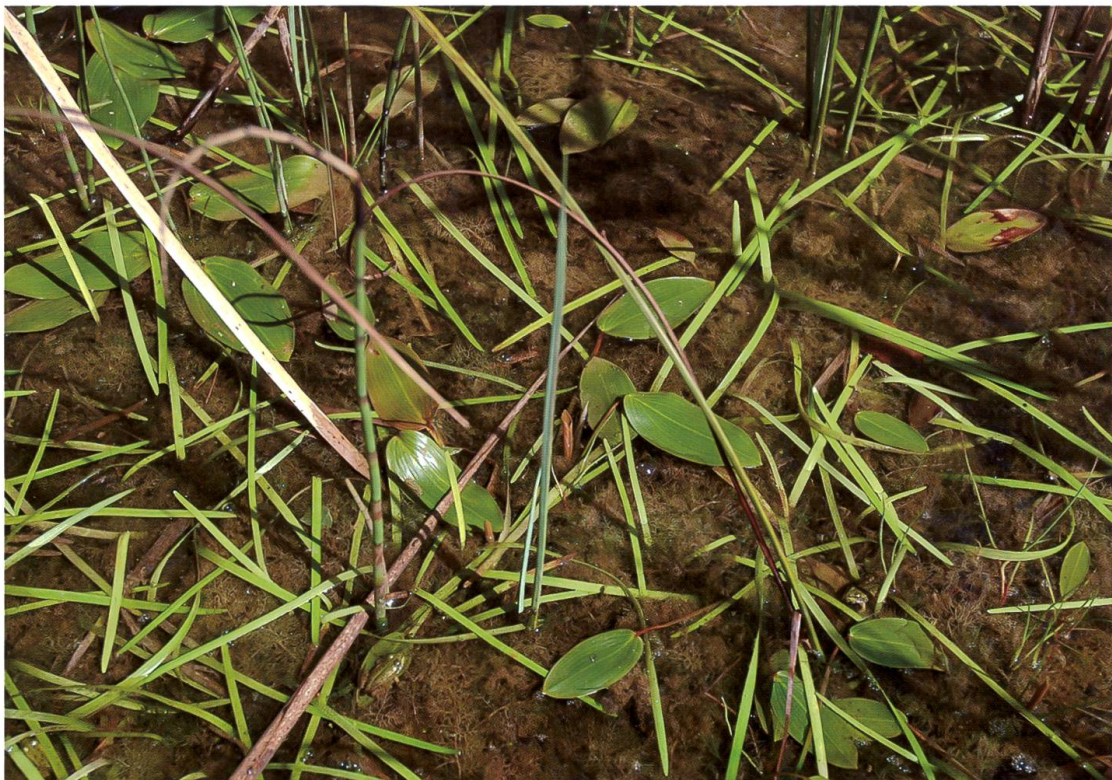
Fig. 7. Plan d'eau rempli de Utricularia australis , Auslikon (Pfäffikon), 8.9.2008. Un des 2 sites de captures de Hydroporus scalesianus . Feuilles flottantes: Sparganium natans (lanières étroites) et Potamogeton natans (feuilles ovales).