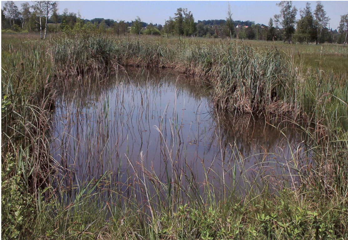
Fig. 6. Site de capture de Graphoderus bilineatus , Robenuserriet, Wetzikon, 24.5.2007.