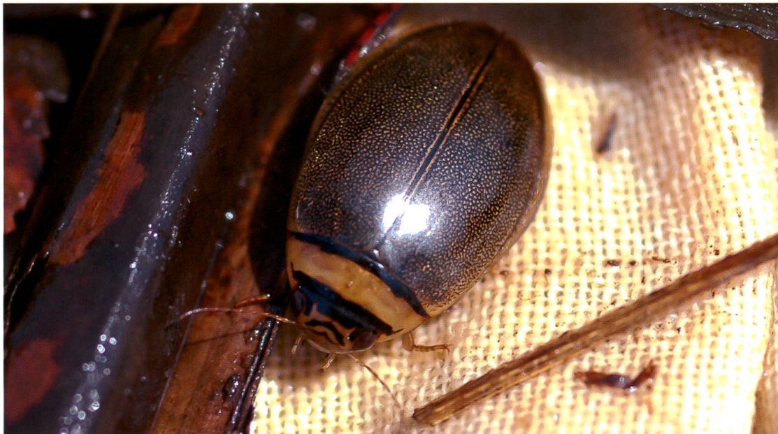
Fig. 2. Graphoderus bilineatus , seule espèce de coléoptère aquatique protégée au niveau national en Suisse. Robenhuserriet, Wetzikon, 24.5.2007.