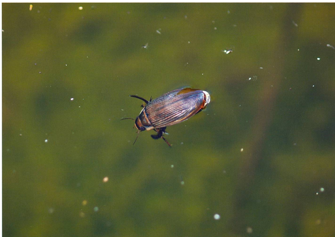
Fig. 5. Dytiscus marginalis , Robenhuserriet, Wetzikon, 24.5 et 26.7.2007. En raison de leurs déplacements fréquents vers la surface de l'eau pour respirer, les larves et les imagos des coléoptères aquatiques sont relativement vulnérables envers les prédateurs, comme les poissons.