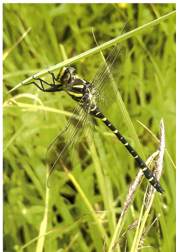
Abb. 13. Ein juveniles Männchen von Cordulegaster boltonii – die Augen sind noch grau, später leuchtend grün – nutzt eine Lichtung (A2) als terrestrisches Habitat in der Reifungsphase. 24.VI.2009.