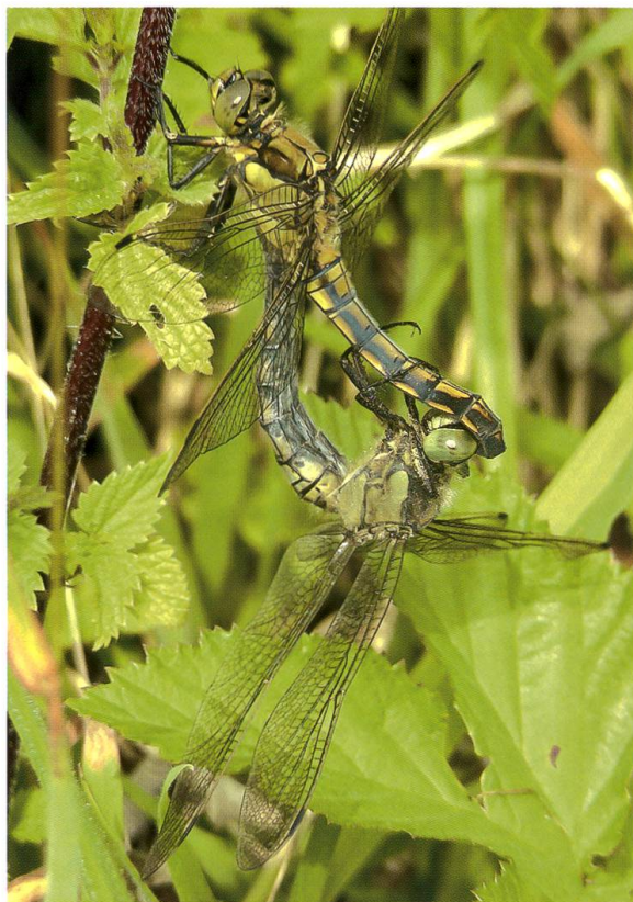
Abb. 15. Paarungsrund von Orithetrum cancellatum mit einem noch nicht voll ausgefärbten Männchen auf einer Waldlichtung, die mehrere Kilometer vom nächsten Brutgewässer entfernt lag. 31.VII.2009.