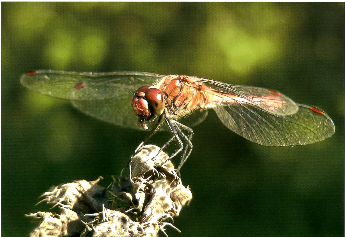
Abb. 8. Dieses Männchen von Sympetrum sanguineum benutzt auf Lichtung B4 den vertrockneten Blütenstand einer Kohldistel Cirsium oleraceum als Warte, wohin es nach erfolgreicher Jagd zum Verzehr der Beute zurückgekehrt ist. 31.08.2009.

Auf den acht Waldlichtungen mit einer Gesamtfläche von nur 7,3 ha wurden vier Fünftel der regionalen Libellenfauna nachgewiesen, wobei der Anteil der mindestens auf einer Lichtung bodenständigen Arten 32% betrug. Aber auch diese nutzten die terrestrischen Habitate innerhalb der Lichtungen mit ihrem reichen Angebot von Beuteinsekten, Ansitzplätzen und windgeschützten Flugräumen für die Jagd sowie von mikroklimatisch günstigen Stellen zur Thermoregulation. Bei den Lichtungen handelte es sich in den meisten Fällen um strukturell und floristisch vielfältige Feuchtwiesen, die jährlich nur einmal und erst im Herbst geschnitten wurden. Einige der südexponierten Waldränder waren zudem zur Biotopaufwertung aufgelichtet. Als