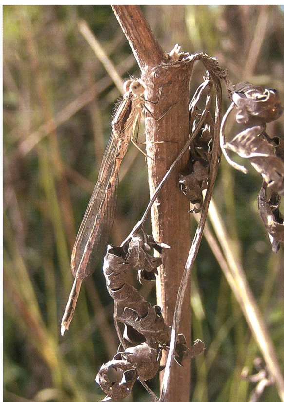
Abb. 12. Sympecma fusca ist die einzige Libellenart im Gebiet, die auf Lichtungen als Imago überwintert. Ihre Tarnfarbe macht sie in dürerer Gras- und Krautvegetation beinahe unsichtbar. Lichtung B2, 02.IX.2007.

Libellula fulva hielt sich auf den Lichtungen und den angrenzenden Waldungen des Gebietes A regelmässig während der Reifung und auch später zur Jagd auf. Die Kopulationsmarken bei adulten Männchen auf den Lichtungen wiesen ferner darauf hin, dass sie mehrfach zwischen dem Brutgewässer und den terrestrischen Habitaten wechselten. Dies widerlegt die Vermutung, dass “ L. fulva nur selten terrestrische Lebensräume aufsucht” (Sternberg & Buchwald 2000: 452). Hardersen (2007) ortete mit Antennen versehene Tiere während der ersten Tage nach dem Schlupf telemetrisch in der Nähe des Auflassortes auf Büschen und Bäumen in Höhen zwischen 1,8 und 31 m.