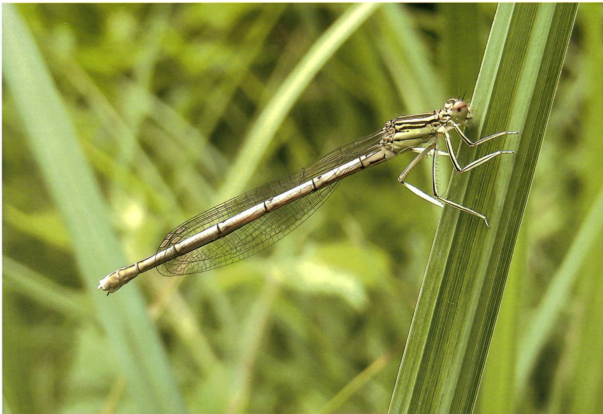
Abb. 4. Adultes Weibchen von Platycnemis pennipes nach erfolgreichem Beuteflug auf Lichtung A4 in 820 m Entfernung vom nächstgelegenen Brutgewässer. 08.VI.2009.

Platycnemis pennipes (Abb. 4, 5) und Libellula fulva (Abb. 6, 7) traten in allen Lichtungen des Gebietes A auf, jedoch auf keiner des Gebietes B (Tab. 1). Beide Arten entwickelten sich regelmässig und in Anzahl im Kämmoosweiher. Um die vier Lichtungen auf kürzestem Weg zu erreichen, mussten sie minimal 0,3 km und maximal 1,1 km zurücklegen (Abb. 2). Dabei war es nötig, breite Strassen und geschlossene Waldstücke zu überfliegen. P. pennipes wurde am häufigsten ( n = 78 ) auf der dem Brutgewässer am nächsten gelegenen Lichtung beobachtet, auf der am weitesten davon entfernten am seltensten ( n = 1 ). Adulte Weibchen hielten sich häufiger in den