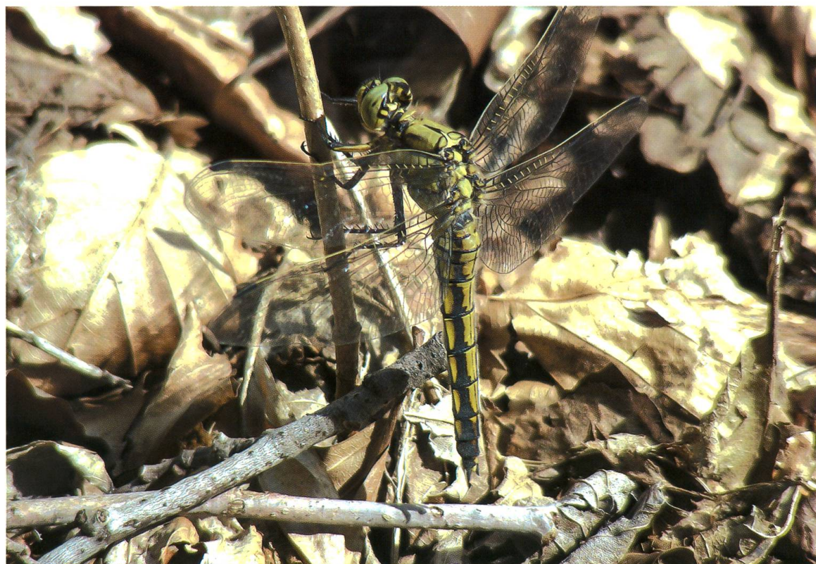
Abb. 11. Ein adultes Weibchen von Orthemtrum cancellatum wärmt sich am aufgelichteten Waldrand von Lichtung A4 über dem Boden auf und benutzt ein vertikales Sitzsubstrat. 26.VI.2007.

Aeshna cyanea konnte sich zwar in der Hälfte aller Lichtungen – in Moorgräben – auch entwickeln, wurde aber eher selten auf den offenen Wiesenflächen angetroffen. Ihre Reifungs- und Jagdhabitate lagen in den angrenzenden Wäldern, wo sie auf typische Art in Schneisen, über Waldwegen oder an lichten Stellen Nahrung suchten (vgl. auch Kaiser 1974, Peters 1987: 75). Im Gegensatz zu A. cyanea hatte A. grandis in keiner der Lichtungen Entwicklungsmöglichkeiten. Die im Flug auffällige, bis in 10 m Höhe jagende “Waldlibelle” (Peters 1987: 68) nutzte aber den freien Luftraum von vier der waldumschlossenen Flächen regelmässig zur Nahrungssuche. Robert (1959: 198) beobachtete im Jura nahrungssuchende Einzeltiere oder kleine Schwärme über Waldweiden. Bäume spielen bei beiden Arten eine Rolle als Ruhehabitate (z.B. Robert 1959: 188, Sternberg & Buchwald 2000: 62).