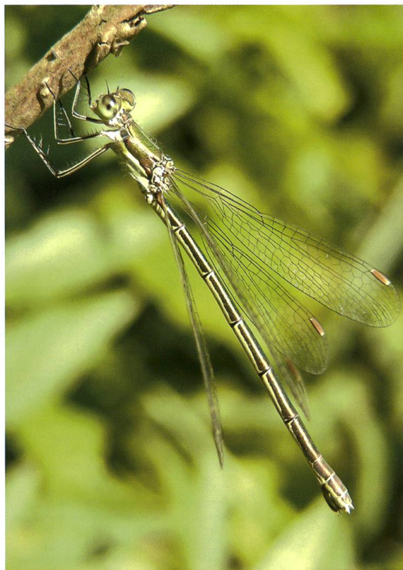
Abb. 14. Weibchen von Lestes virens am Waldrand des Grossweierrieds, Rüti ZH. Die Art nutzte hauptsächlich Langgraswiesen und Waldländer nahe dem Brutgewässer und war nur selten Gast auf einer benachbarten Lichtung. 31.VIII.2009.

Sympetrum sanguineum erwies sich als mobile Art, die alle Lichtungen aufsuchte. Sie entwickelte sich in grosser Anzahl in den Nachbargebieten Grossweier und Kämmoosweiher. Die Nutzung von Strukturelementen zur Jagd und zur Thermo-