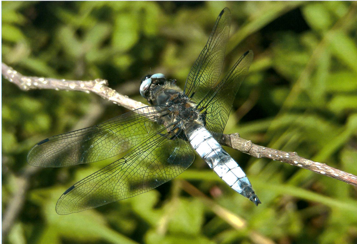
Abb. 7. Adultes Männchen von Libellula fulva mit abgeschabter Wachsberiefung am fünften Abdominalsegment (Kopulationsmarke) auf Lichtung A1. Die Paarung erfolgte höchstwahrscheinlich am 350 m davon entfernten Kämmoosweiher. 14.VI.2009.

Zweimal wurden in Lichtungen abseits des Wassers Paarungen beobachtet. Im einen Fall scheuchte ich ein Paarungsrad von Orthemtrum cancellatum aus der Krautvegetation auf, das sich nach kurzem Flug wieder setzte (Abb. 15). Die Stelle lag 3 km vom nächstmöglichen Brutgewässer entfernt. Im zweiten Fall patrouillierte ein Cordulegaster -Männchen – vermutlich boltonii – langsam im Tiefflug entlang dem Waldrand. Plötzlich wurde es auf derselben Flugroute von einem Weibchen überholt. Dieses wurde kurz darauf vom Männchen ergriffen und sofort angekoppelt. Noch