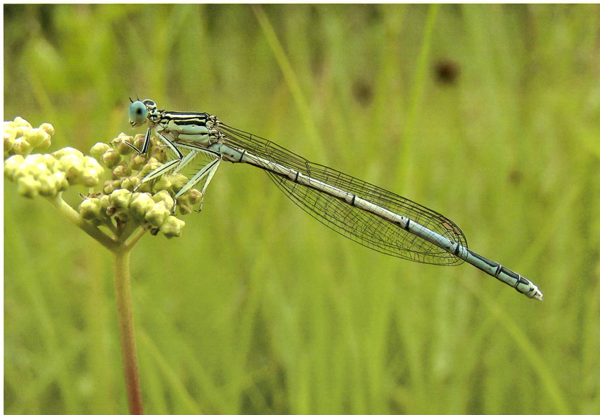
Abb. 5. Männchen von Platycnemis pennipes in der Reifungsphase auf Lichtung A3. Als Jagdwarte benutzt es den aufragenden Blütenstand des Moor-Geissbartes Filipendula ulmaria . 24.VI.2009.

Somatochlora flavomaculata und Sympetrum sanguineum wurden auf fast allen Lichtungen regelmässig und/oder häufig angetroffen. Im Gebiet B stammten vermutlich die meisten Individuen von S. flavomaculata aus dem benachbarten Grossweierried, zu einem geringen Teil wahrscheinlich auch aus der Lichtung B1, wo sich die Art in einem schmalen Grabenabschnitt entwickeln konnte. In den Lichtungen B3 und B4 gab es für sie keine, in der Lichtung B2 höchstens nur kleine und wenig geeignete Brutgewässer. Damit waren wohl die meisten Individuen zugeflogen. In allen geprüften Fällen handelte es sich um Männchen. Paarungen wurden keine beobachtet.