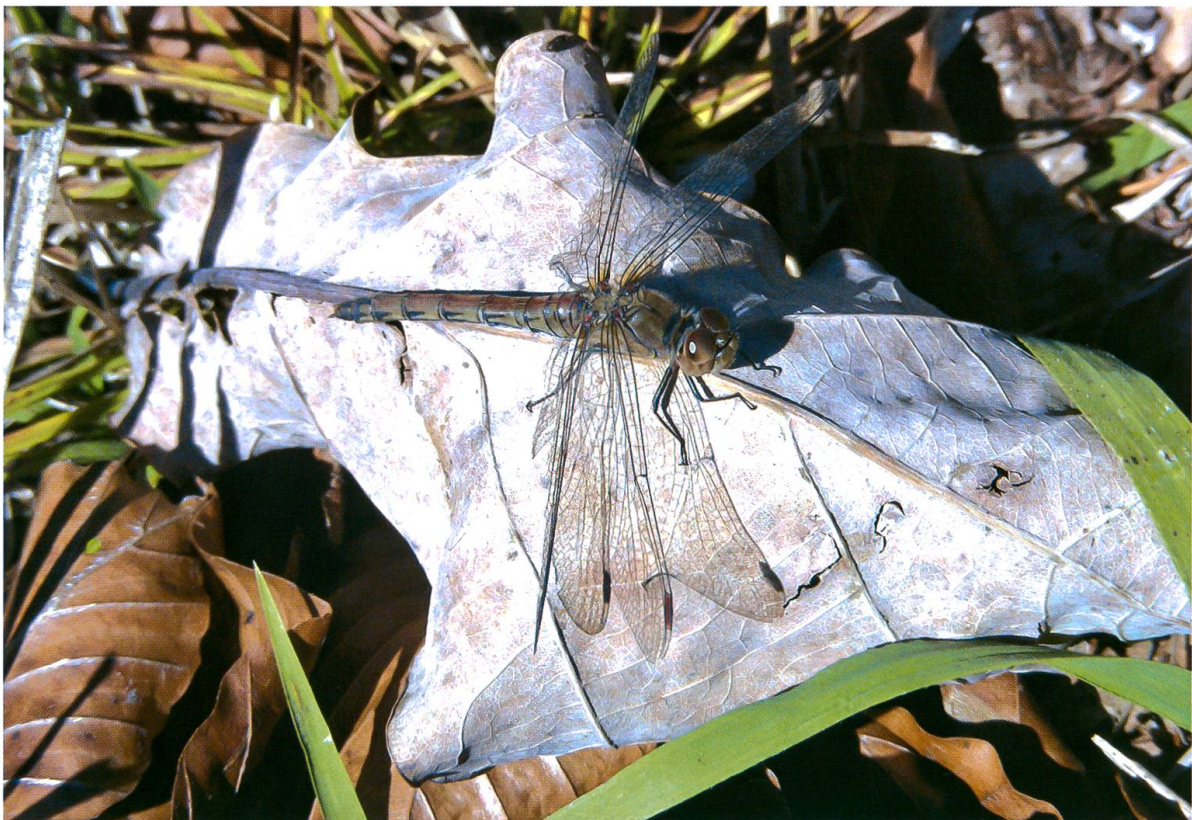
Abb. 10. Ein altes, reproduktiv noch aktives Weibchen von Sympetrum striolatum nutzt die helle Fläche eines trockenen Laubblattes am besonnten Waldrand zur Thermoregulation und als Warte für Jagdflüge. Grossweierried Rüti ZH, 25.XI.2009.

Lestes virens wurde nur einmal in Lichtung B2 angetroffen, obwohl sich die Art im nahen Grossweierried in Anzahl entwickelte. Die Individuen nutzten vor allem den Waldrand nahe dem Brutgewässer als terrestrisches Habitat. Möglicherweise erwies sich geschlossener Wald als Flughindernis. Jödicke (1997: 181) beobachtete in Nieder-