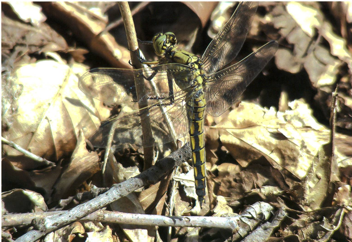
Abb. 11. Ein adultes Weibchen von Orthemtrum cancellatum wärmt sich am aufgelichteten Waldrand von Lichtung A4 über dem Boden auf und benutzt ein vertikales Sitzsubstrat. 26.VI.2007.

Aeshna cyanea konnte sich zwar in der Hälfte aller Lichtungen – in Moorgräben – auch entwickeln, wurde aber eher selten auf den offenen Wiesenflächen angetroffen. Ihre Reifungs- und Jagdhabitate lagen in den angrenzenden Wäldern, wo sie auf typische Art in Schneisen, über Waldwegen oder an lichten Stellen Nahrung suchten (vgl. auch Kaiser 1974, Peters 1987: 75). Im Gegensatz zu A. cyanea hatte A. grandis in keiner der Lichtungen Entwicklungsmöglichkeiten. Die im Flug auffällige, bis in 10 m Höhe jagende “Waldlibelle” (Peters 1987: 68) nutzte aber den freien Luftraum von vier der waldumschlossenen Flächen regelmässig zur Nahrungssuche. Robert (1959: 198) beobachtete im Jura nahrungssuchende Einzeltiere oder kleine Schwärme über Waldweiden. Bäume spielen bei beiden Arten eine Rolle als Ruhehabitate (z.B. Robert 1959: 188, Sternberg & Buchwald 2000: 62).