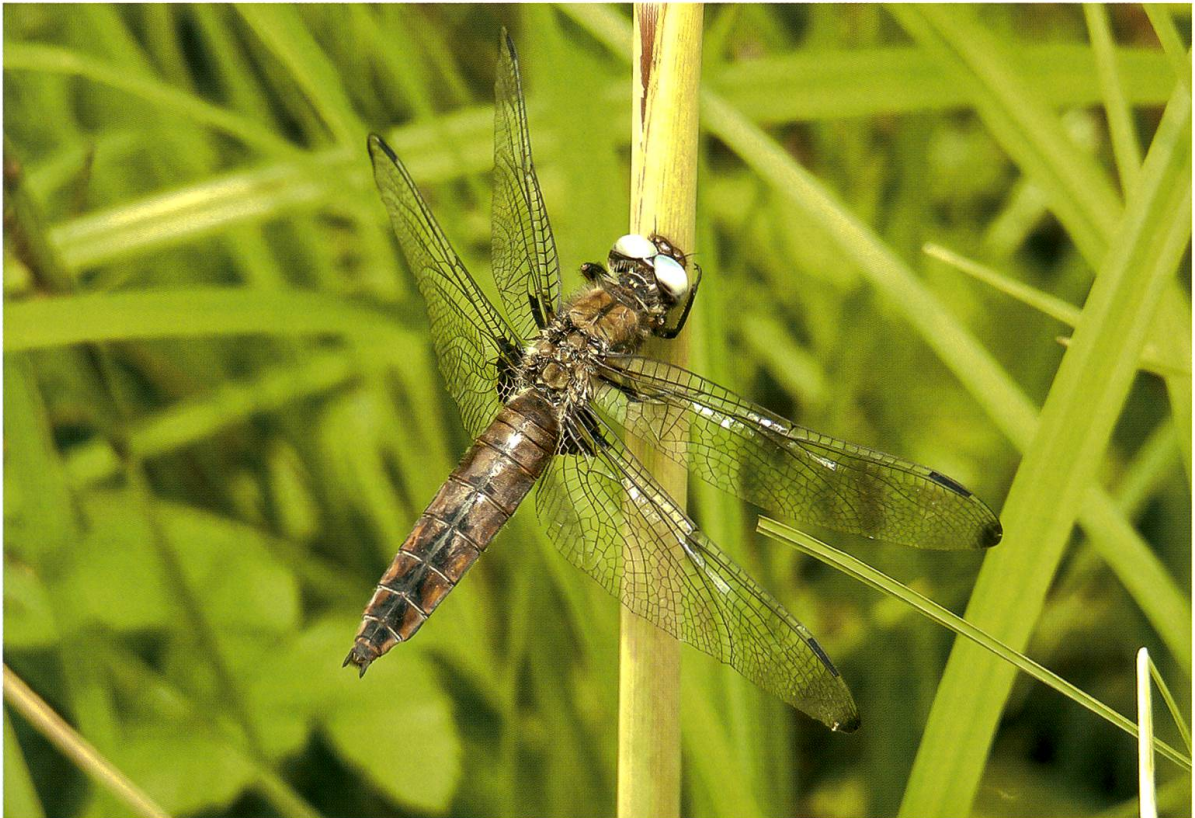
Abb. 6. Ein altes Weibchen von Libellula fulva benutzt einen kräftigen Schilfhalm auf Lichtung A4 als Warte für Jagdflüge. 08.VI.2009.

Bei günstigem Flugwetter waren die Libellen oft mit Jagen beschäftigt. Die Flugjäger (“flier-Typen”) unter ihnen – Aeshnidae, Cordulegastridae und Corduliidae – patrouillierten in Höhen von etwa einem bis drei Metern (v.a. Somatochlora flavomaculata ) und mehr (v.a. Aeshna grandis ) über den Streuwiesen oder entlang der besonnten Waldränder. Plötzliche Richtungsänderungen in der Flugbahn, insbesondere nach oben, deuteten auf Beutestösse. Der Jagderfolg liess sich aber nur bei den Ansitzjägern (“percher-Typen”) genauer feststellen, nachdem sich die Libellen zum Beuteverzehr auf die Warte gesetzt hatten (Abb. 8, 9). Die Kleinlibellen (Zygoptera) jagten ebenfalls meist von erhöhter Warte aus (Abb. 5). Als Lauerplätze dienten aus der Ve-