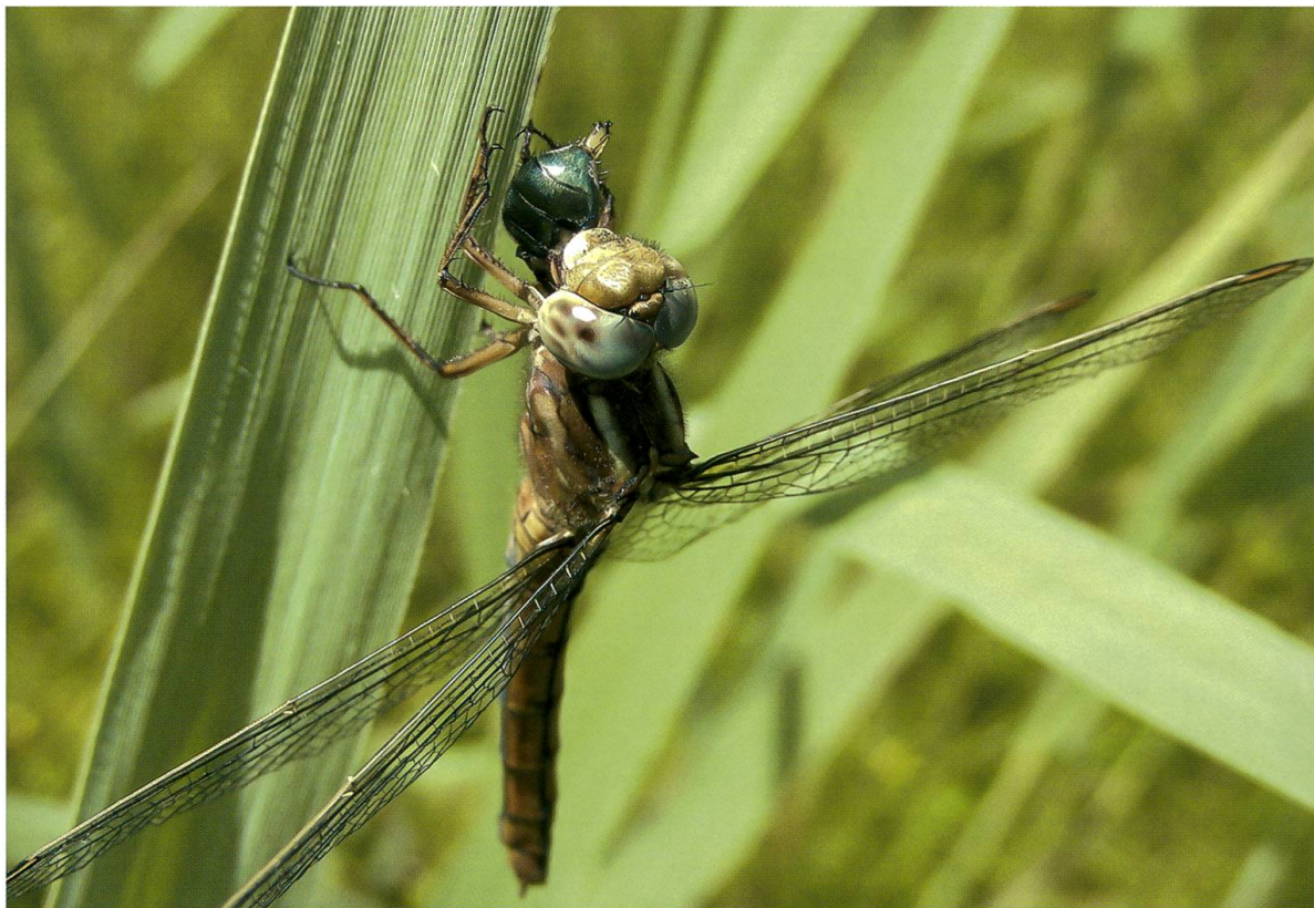
Abb. 9. Adultes Weibchen von Orthetrum coerulescens beim Verzehr einer Fliege ( Lucilia sp.) auf Lichtung A2. 29.VI.2009.

Calopteryx virgo flog regelmässig und besonders häufig auf den Lichtungen A4, B2 und B4, wo sie sich auch entwickelte und sich hier vorwiegend entlang der kleinen Fliessgewässer aufhielt. Auf den übrigen fünf Lichtungen trat die Art weit seltener und in geringer Anzahl auf. Während und nach der Reifung waren die Individuen meist an kleinflächig besonnten Stellen im Wald zu finden, wo sie auch jagten. Für die Fortpflanzung der als schattentolerant geltenden Art (Sternberg & Buchwald 1999: 206) sind die Fliessgewässerstrecken entlang der Lichtungen weit bedeutsamer als