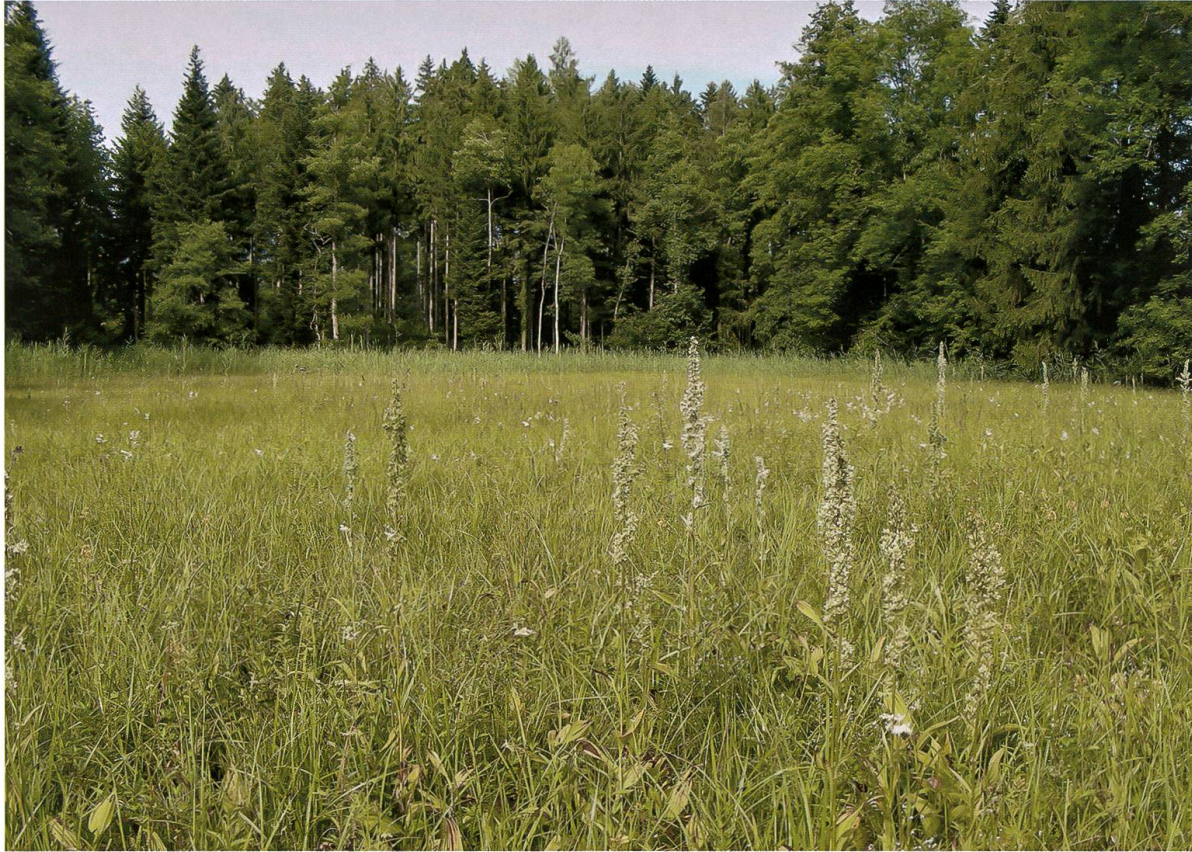
Abb. 1. Waldlichtung A4 Rütliwald, Rütli ZH. Die Riedwiese mit Weissem Germer Veratrum album im Vordergrund und leicht verschilftem Teil im Hintergrund wird jährlich im Herbst gemäht. Der Waldrand links und im Hintergrund ist aufgelichtet, dem Waldrand rechts entlang verläuft ein kleiner Bach. Sommeraspekt 13.VII.2009.