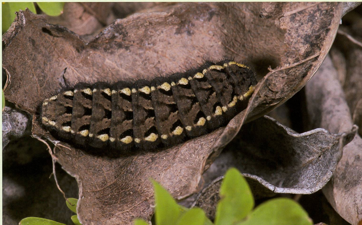
Abb. 2. Abweichend gezeichnete Farbmorphe der Raupe des Schwarzen Apollofalters (Wallis, Baltschiedertal, 15. 4. 2007,).