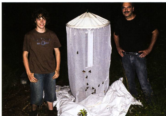
Abb. 5. Zweit- und Drittautor (l.) als erfolgreiche «Bärenjäger» mit einem Teil der «zur Strecke gebrachten» (und später wieder freigelassenen) Beute. Spiezwiler 9.VI.2007.

Am 10.VI. wurde nachmittags eine Nachkontrolle an der Lichtfangstelle durchgeführt. Dabei wurden in drei Metern Umkreis des Lampenstandorts (Leuchtturm) in der Vegetation zwei Männchen und ein Weibchen des Augsburger Bären gefunden.