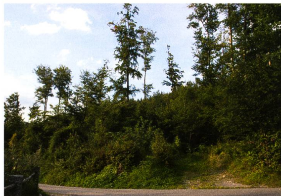
Abb. 3. Raupen- und Falterfundort Spiezwiler. Die beiden Raupen wurden in der Einfahrt gefunden, der Pfeil markiert die Frasspflanze der Raupe vom 30.VIII.2008. Aufnahmedatum 31.VIII.2008.

Eine weitere Fundstelle des Augsburger Bären befindet sich auf einer terrassenartigen Fläche oberhalb der Kander, wo die Falter entlang eines Waldweges zum Licht kamen. Nahe am Ufer wachsen verschiedene Gräser, Moose sowie die Orchideenart Cephalanthera damasonium (Mill.) Druce (Weisses Waldvögelein). Nach dem Ufersaum von etwa 5 m Breite beginnt ein lichter Wald (u. a. Fichten und grosse Buchen, Unterwuchs mit Brombeer- und Himbeersträuchern, Gräsern und Moosen). Der Untergrund erscheint permanent feucht.