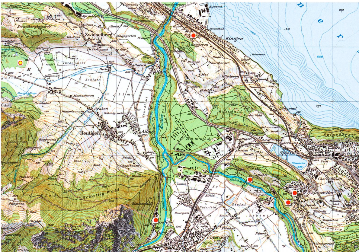
Abb. 1. Lage des Untersuchungsgebietes und Fundorte von Pericallia matronula am Südufer des Thuner Sees. Der gelbe Punkt markiert die Fundstelle von 1959 bei Reutigen.

Es wurden zwei verschiedene Lichtfanganlagen eingesetzt: 1 x 20 W Mischlicht und 2 x 20 W Schwarzlicht-Leuchtstoffröhren im Leuchtturm (batteriebetrieben) sowie 250 W-Quecksilberdampfampe vor Leuchttuch (mit Generator).