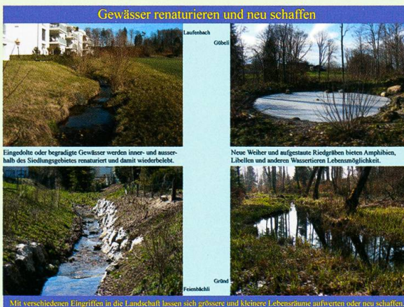
Abb. 7. Zu Naturschutzzwecken renaturierte und neu geschaffene Gewässer.