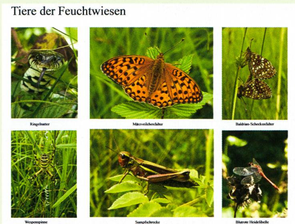
Abb. 3. Sechs Beispiele typischer Tierarten der Feuchtwiesen.