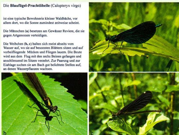
Abb. 5. Die Blauflügel-Prachtlibelle als Fliessgewässerart.

Um die Artenvielfalt der Feucht- und Magerwiesen sowie der kleinen Fliess- und Stehgewässer zu erhalten, braucht es spezifische Naturschutzmassnahmen. Die Lebensräume müssen nicht nur vor negativen Eingriffen geschützt, sondern auch gepflegt und teils auch neu geschaffen werden (Abb. 7). Feucht- und Trockenwiesen sind