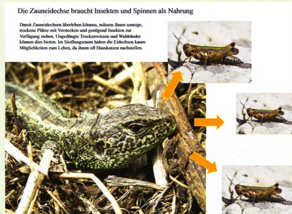
Abb. 2. Tafel zur Nahrungsökologie der Zauneidechse.