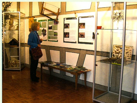
Abb. 8. Naturschutzakteure in der Gemeinde stellen sich auf Plakaten vor.