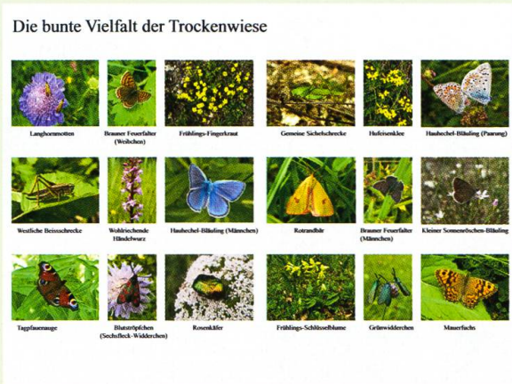
Abb. 1. Beispiele aus der Insekten- und Pflanzenwelt auf Trockenwiesen.

Am Beispiel geschützter Feuchtwiesen wird demonstriert, inwiefern sich ungedüngtes, nur einmal jährlich gemähtes Streuland vom intensiv genutzten Grünland bezüglich Futterwert, Ertragswert und Naturschutzwert unterscheidet. Dabei kommt deutlich heraus, dass die Streuwiesen dank der Bewirtschaftungsbeiträge mindestens so hohe Ertragswerte ausweisen wie die Futterwiesen. Die Vielfalt typischer, attraktiver und besonderer Arten kommt anhand ausgewählter Orchideen, Tagfalter, Heuschrecken und weiterer Tiergruppen zum Ausdruck (z.B. Abb. 3). Soll der Kleine Würfel-Dickkopffalter Pyrgus malvae (Linnaeus, 1758) vorkommen, braucht es auf Feuchtwiesen die Blutwurz Potentilla erecta (Linnaeus, 1753) als Futterpflanze der Larven (Abb. 4). Libellen wie der Spitzenfleck Libellula fulva Müller, 1764 oder die Gefleckte Smaragdlibelle Somatochlora flavomaculata (van der Linden, 1825) nutzen die insektenreichen Streuwiesen auf Waldlichtungen als Jagdräume, zur Thermoregulation und zur Reifung. Wie kompliziert die Wechselbeziehungen zwischen den Arten sein können, wird am Beispiel des Kleinen Moorbläulings Phengaris alcon (Denis & Schiffermüller, 1775) mit seinem abenteuerlichen Lebenszyklus beschrieben; die Raupe lebt zunächst am Lungenenzian Gentiana pneumonanthe Linnaeus, 1753 und später parasitisch im Nest der Ried-Knotenmeise Myrmica scabrinodis Nylander, 1846.