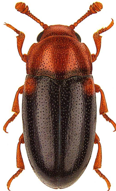
Abb. 5. Der Zweifleckige Pilzkäfer Dacne bipustulata (Thunberg, 1781) ist ein Pilzbewohner. Er bevorzugt sonnenexponierte, trockenere Standorte. Die Larve entwickelt sich an zähfleischigen oder eingetrockneten Fruchtkörpern verschiedenster Porlinge, vorzugsweise an Laubholz.