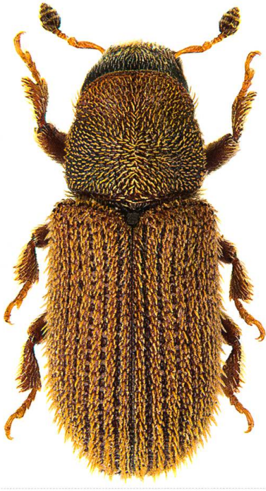
Abb. 2. Der Efeu-Borkenkäfer Kissophagus hederæ (Schmitt, 1843) ist ein Frischholzbewohner. Seine Larven leben ausschliesslich unter der Rinde von austrocknenden starken Ästen des Efeu Hedera helix .