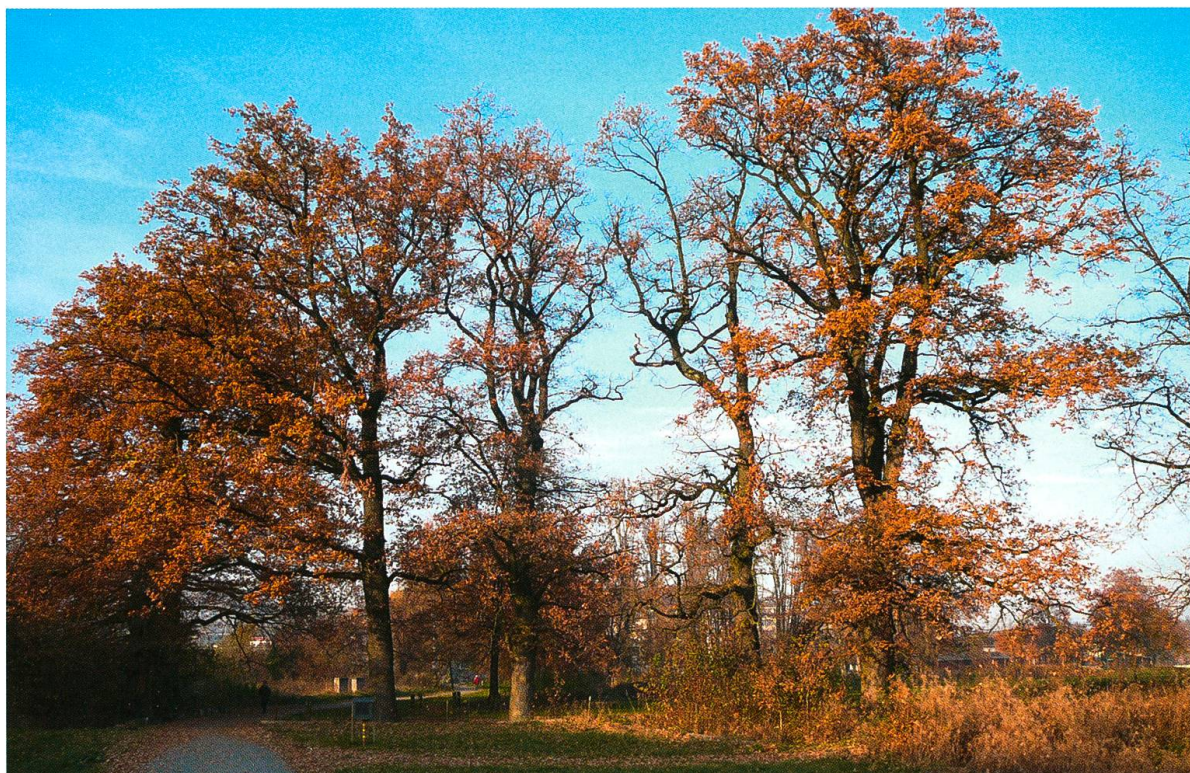
Abb. 1. Einige der über 50 Alteichen im «Allmendpark».