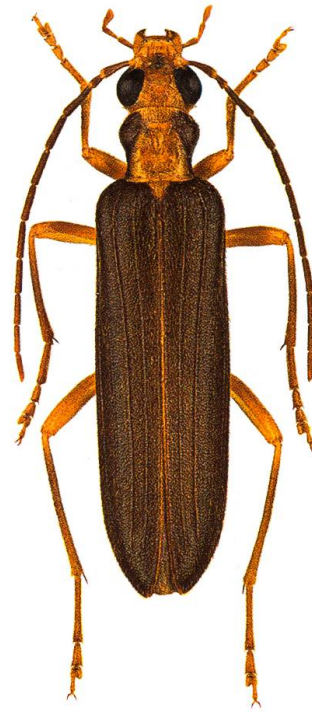
Abb. 3. Der Krainische Scheinbockkäfer Nacerdes carniolica (Gistel, 1832) ist ein Altholzbewohner. Die Larven entwickeln sich im morschen Nadelholz, besonders von Kiefern und Fichten.