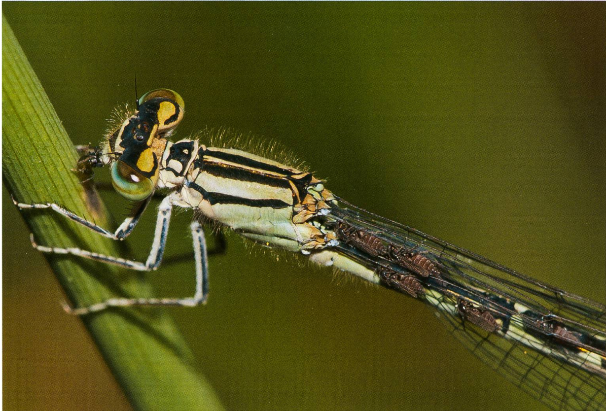
Abb. 4. Weibchen von Enallagma cyathigerum (Charpentier, 1840) mit mindestens fünf Gnitzen Forcipomyia paludis an den Flügeln. Trouville, Cudrefin (VD), 25.06.2010.