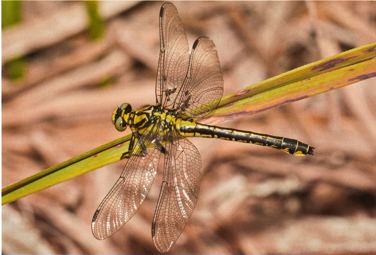
Abb. 6. Weibchen von Gomphus vulgatissimus mit 17 auf allen Flügeln verteilten Gnitzen Forcipomyia paludis. Trouville, Cudrefin (VD), 07.06.2011.