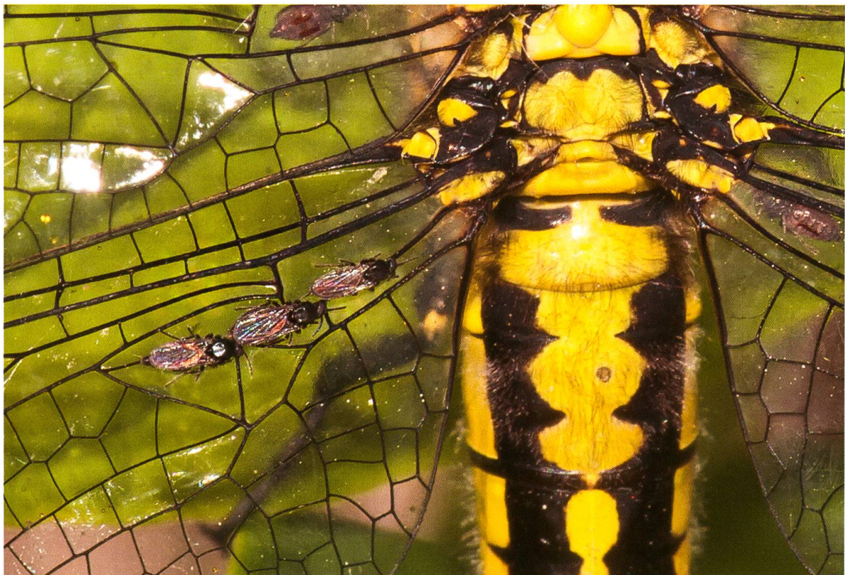
Abb. 7. Drei Gnitzen Forcipomyia paludis auf der Oberseite und zwei auf der Unterseite der Flügel eines Weibchens von Gomphus vulgatissimus. Trouville, Cudrefin (VD), 07.06.2011.