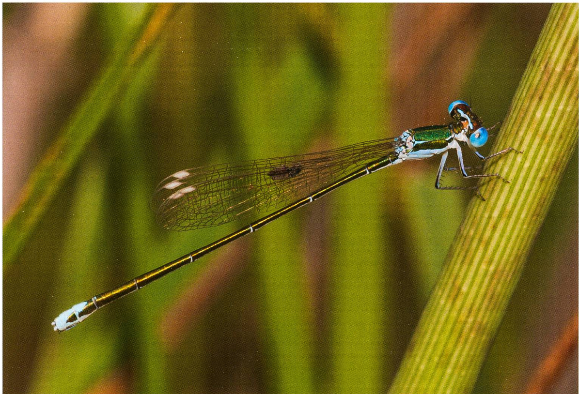
Abb. 3. Männchen von Nehalennia speciosa mit einer Gnitze Forcipomyia paludis. Trouville, Cudrefin (VD), 25.06.2010.