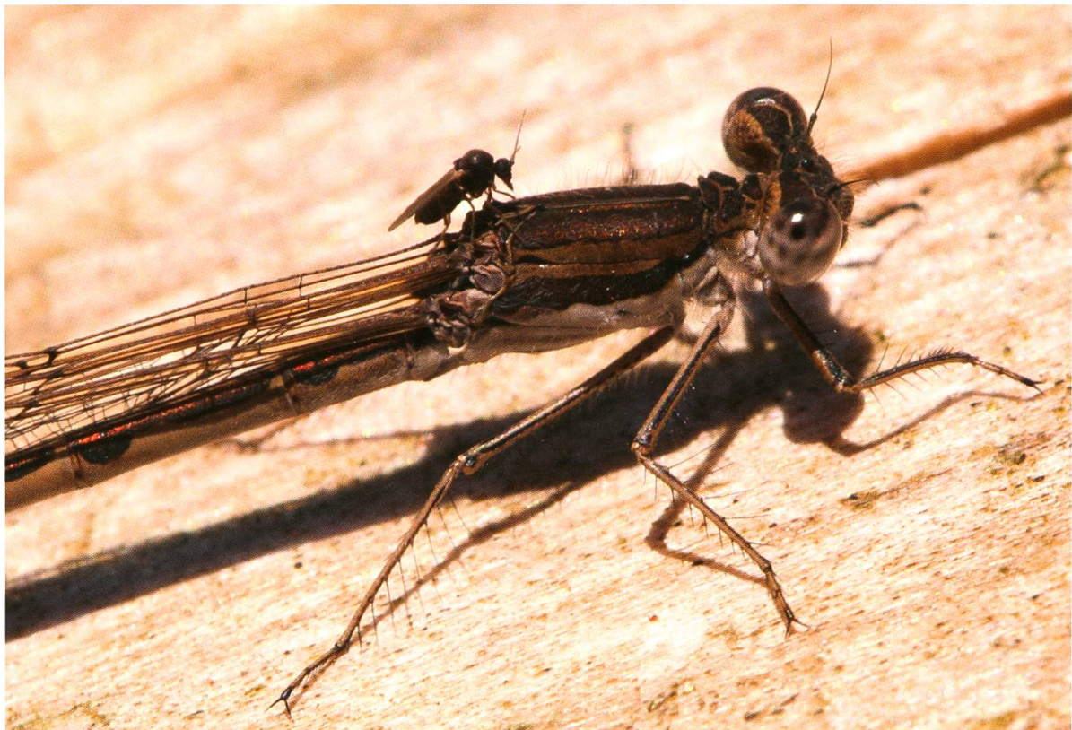
Abb. 5. Männchen von Sympecma fusca mit Gnitze, bei der es sich vermutlich nicht um Forcipomyia paludis handelt. Bruni, Pfungen (ZH), 06.03.2008.