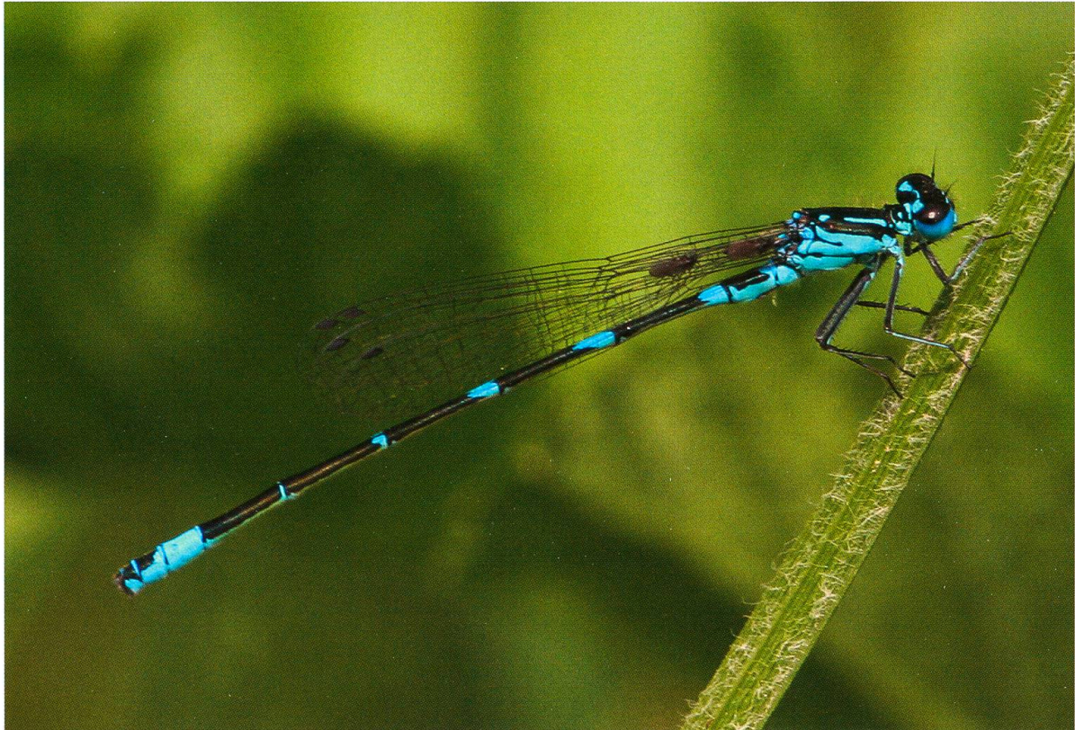
Abb. 2. Männchen von Coenagrion pulchellum mit zwei Gnitzen Forcipomyia paludis. Barchetsee, Oberneunforn (TG), 10.06.2007.