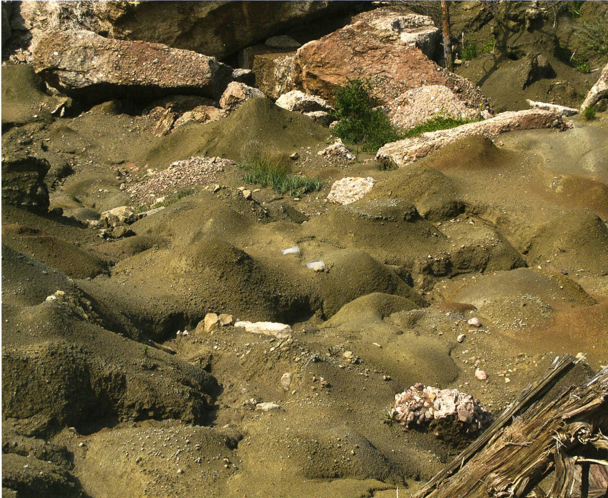
Abb. 3. Standort mit den höchsten Abundanzen von Bembidion (Peryphanes) italicum De Monte, 1943 im obersten Abschnitt des «Gribscher Bergsturzes» am Rossberg oberhalb Goldau SZ (ca. 970 m ü.M.).

Bembidion italicum genauer abzugrenzen. Es wurde festgestellt, dass sich Literaturangaben von Bembidion brunnicorne (u. a. aus Kärnten und aus den Meeralpen) bei genauer Untersuchung auf Bembidion italicum beziehen.