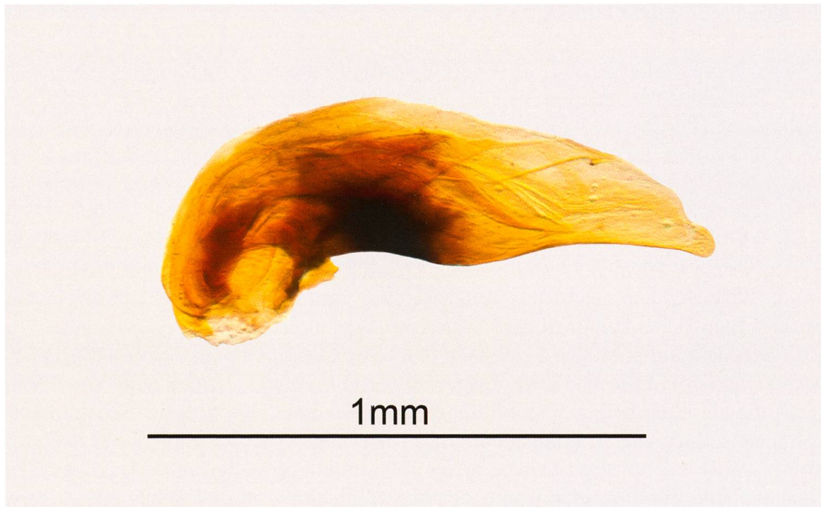
Abb. 2. Aedoeagus von Bembidion (Peryphanes) italicum De Monte, 1943 mit charakteristisch konvexer Wölbung auf der Ventralseite.

Schluss der Fangperiode gegen Ende September regelmässig Individuen in den Bodenfallen festgestellt werden konnten, fehlten diese 2009 bereits ab Ende Mai vollständig. Im Vergleich dazu stammen die meisten Handfänge aus der Südschweiz und dem Wallis aus dem Monat Juni (Luka et al. 2009).