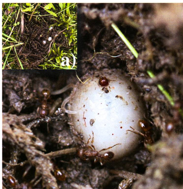
Abb. 2. Myrmekophile Larve der Schwebfliege Microdon myrmicae in einem Nest der Ried-Knotenameise ( Myrmica scabrinodis) in den «Auen» bei Stäfa (ZH) am 23.8.2010. Das Einschubbild (a) des ganzen Nestes zeigt, dass insgesamt mindestens drei solcher Larven vorhanden waren.