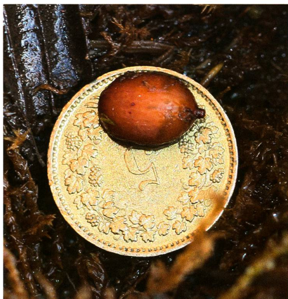
Abb. 4. Frisch einem Nest der Ried-Knotenameise ( Myrmica scabrinodis ) entnommene Puppe der myrmekophilen Schwebfliege Microdon myrmicae auf einem 5-Rappen-Stück am 7.4.2011.

Nicht gänzlich vernachlässigen dürfen wir, dass Formica lemani Bondroit, 1917, zu Zeiten von Andries (1912) noch gar nicht beschrieben war und demzufolge noch als Formica fusca bezeichnet worden wäre. Trotzdem denken wir, dass es Andries (1912) an ihren Fundorten in der Gegend von Bonn (< 200 m ü. M.) tatsächlich mit der echten F. fusca zu tun hatte, da F. lemani dort nie vorgekommen sein dürfte.