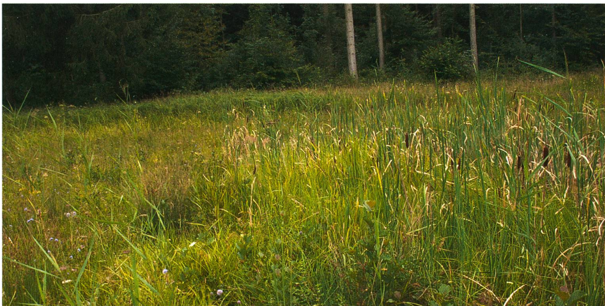
Abb. 1. Flachmoor namens «Auen» in Stäfa (ZH) am 23.8.2010.