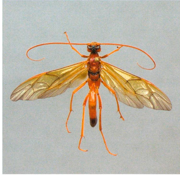
Abb. 2. Opheltes glaucopterus ♀.