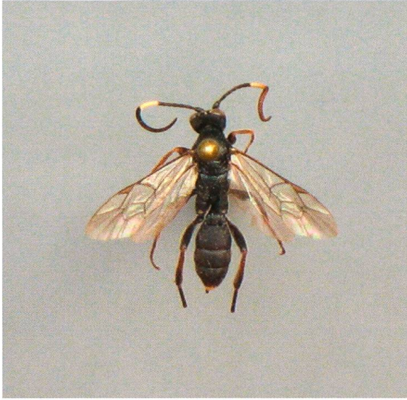
Abb. 1. Virgichneumon krapinensis ♀.