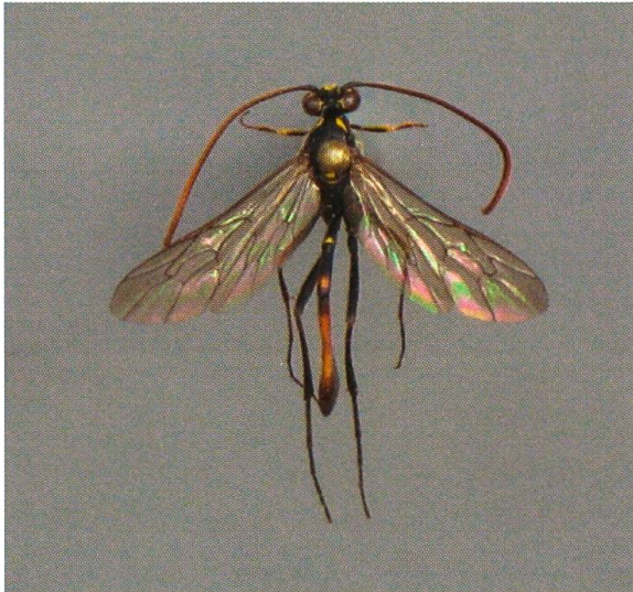
Abb. 3. Hellwigia obscura ♂.