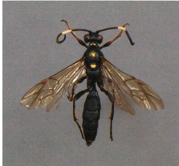
Abb. 4. Coelichneumon biguttulatus ♀.