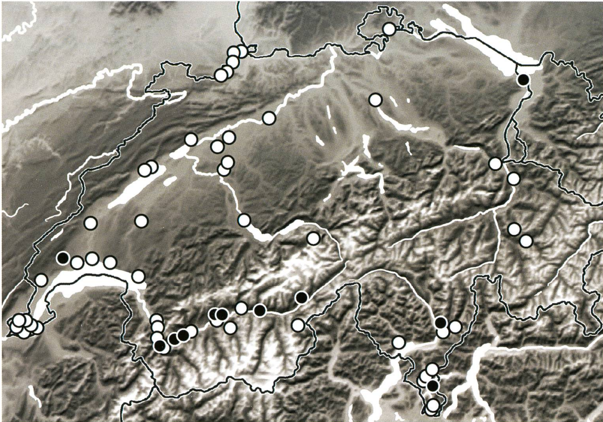
Abb. 4. Fundpunkte von Mecaspis alternans (Herbst, 1795) aus der Schweiz; unausgefüllte Fundpunkte zeigen Funde vor 1960. Datengrundlage boten Fundangaben von 99 Individuen aus den untersuchten Sammlungen sowie ausgewertete Literaturangaben (siehe Text).

liche Karotten ( Daucus carota ssp. sativus ) gefüttert. Dabei frassen sich die Larven Gänge in die 10 \times 20 mm grossen Stücke hinein (Abb. 3B & C). Die 5 erhaltenen Larven zeigten gegenüber ihren Artgenossen aggressives Verhalten (Bisse), und 4 der Larven starben. Eine Larve wurde an Daucus carota weitergezüchtet (alle 3–5 Tage an frische Karottenstücke umgesetzt) und erreichte bis zum 4. Mai eine Grösse von 3 mm (gemessen an der gestreckten Larve von der Kopfkapsel bis zum letzten Segment). Danach starb die Larve ab.