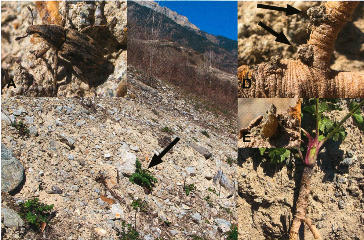
Abb. 1. A) Imago von Mecaspis alternans (Herbst, 1795); B) Fundstelle der belegten Wirtspflanzen (Pfeil auf Pastinaca sativa urens ) am Rand des Auffangbeckens bei Les Salaux; C) freigelegte Wurzel der Wirtspflanze; D) angeheftete Klümpchen mit enthaltenen Eiern im oberen Wurzelbereich; E) freigelegtes olivgrünes Ei.