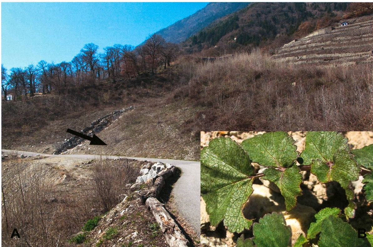
Abb. 2. A) Blick von Osten her ins Auffangbecken. Der Pfeil zeigt die exakte Fundstelle; B) Frassbild von Mecaspis alternans (Herbst, 1795) an Pastinaca sativa urens .