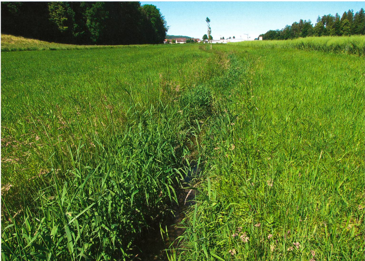
Abb. 2. Habitat von Coenagrion mercuriale im Smaragd-Gebiet Oberaargau: langsam fließende, offene Wiesenbäche mit reichlicher Wasservegetation.