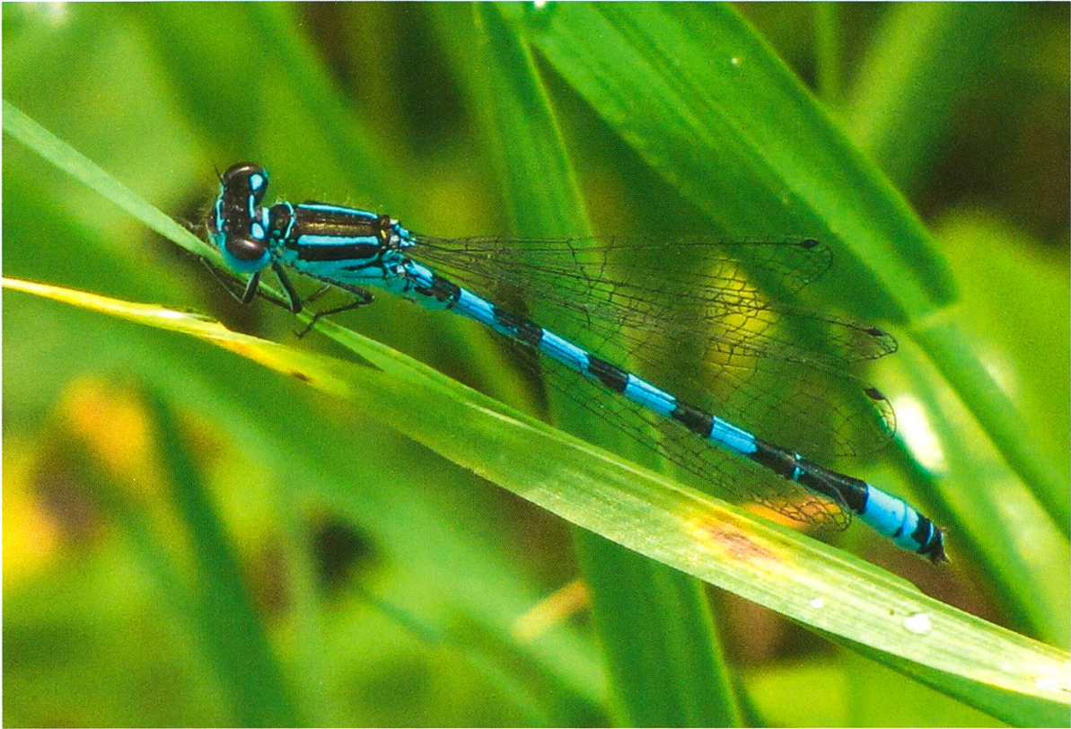
Abb. 1. Männchen von Coenagrion mercuriale .