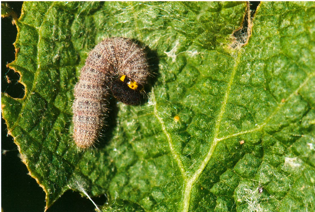
Abb. 5. L 5 -Larve von C. alceae an Alcea rosea in geöffnetem Blattgespinnst (Ittigen, 8.9.2008). Mit dem kugeligen Kopf und den gelben Flecken auf dem Nackenschild sind die Raupen unverwechselbar.

Wie die üblicherweise in zwei Wellen im Mai/Juni und Juli/August auftretenden Ei- und Raupenfunde zeigen, tritt C. alceae im Untersuchungsgebiet normalerweise in zwei Generationen im Jahr auf. Dabei sind Schwankungen um mehrere Wochen in Abhängigkeit von der Wetterentwicklung möglich. Die Ermittlung der genauen phänologischen Entwicklung inklusive Ausnahmen wie z.B. das Auftreten einer partiellen dritten Generation kann jedoch nur durch gezielte und zeitintensive Untersuchungen im Freiland in Kombination mit Zuchtexperimenten erfolgen und soll hier nicht weiter vertieft werden.