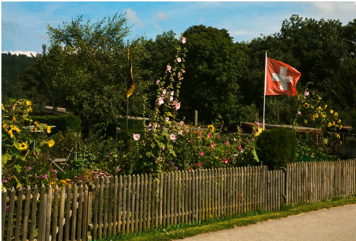
Abb. 2. Lebensraum von C. alceae : Kleingarten mit Alcea rosea (Bolligen, Rörswil, 16.8.2008).

Die zwei politisch selbständigen Agglomerationsgemeinden Ittigen und Bolligen liegen im unteren Worblental nördlich von Bern. Die ehemaligen Bauerndörfer sind heute teilweise verstädtert. Sie sind zusammengebaut und bilden ein gemeinsames, weitgehend geschlossenes Siedlungsgebiet. Der landwirtschaftliche Charakter hat sich