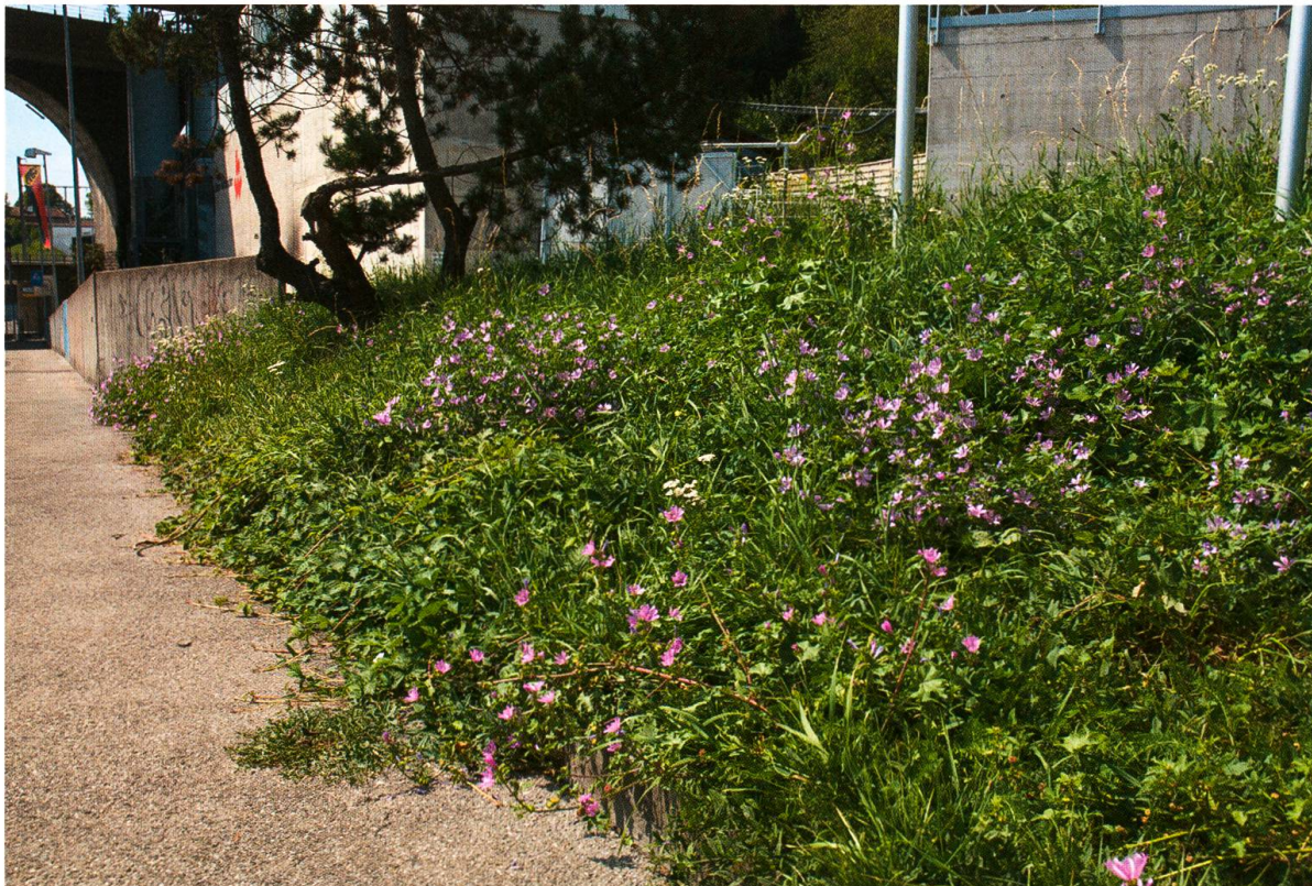
Abb. 1. Lebensraum von C. alceae : Strassenböschung mit Malva sylvestris bei der Autobahnbrücke in Ittigen-Papiermühle. 16.8.2008.

Somit galt der Malven-Dickkopffalter in der Schweiz lange als seltene und gefährdete Art. Möglicherweise ist diese Einschätzung jedoch nur auf geringe bis fehlende gezielte Suche insbesondere nach den leichter nachweisbaren Präimaginalstadien zurückzuführen. In den letzten Jahren weisen zahlreiche Beobachtungen und Meldungen allerdings darauf hin, dass sich die Art im Schweizer Mittelland ausbreitet (CSCF 2012). Dieser Trend wird auch an vielen Stellen in Mittel- und Osteuropa be-