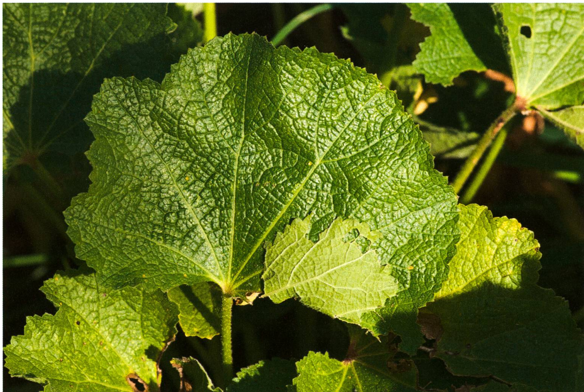
Abb. 4. Blattgespinst und Frassspuren einer erwachsenen Raupe von C. alceae an Alcea rosea (Ittigen, 21.9.2008).