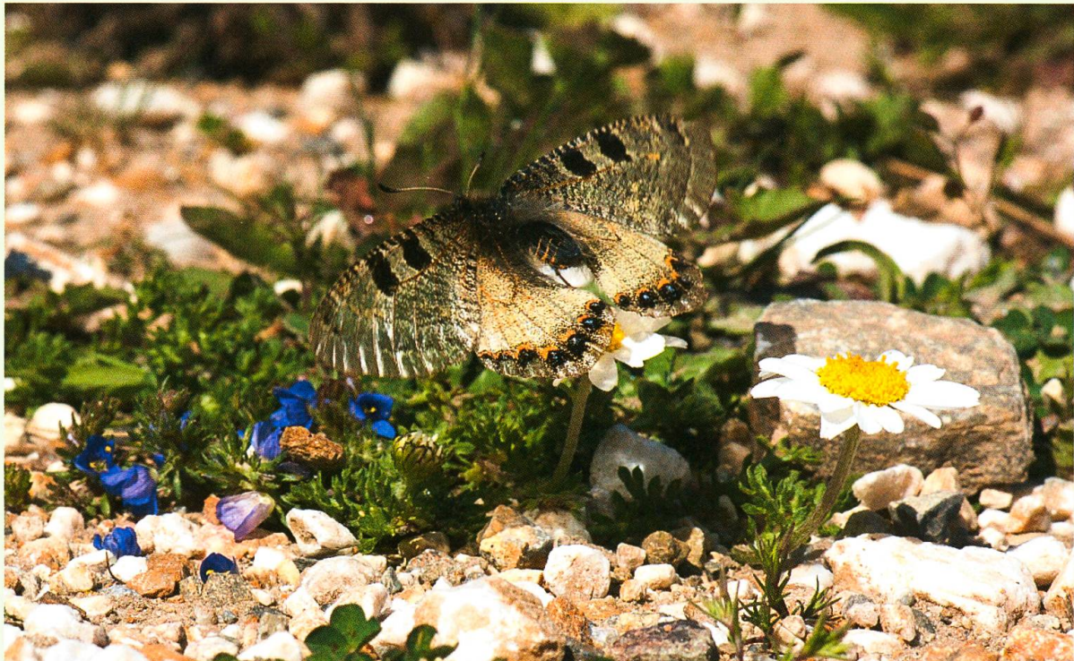
Archon apollinus (Herbst, 1798) Samos-Exkursion EVB, Oros Ambelos, April 2010.

Naturhistorisches Museum der Burgergemeinde Bern, Bernastrasse 15, 3005 Bern