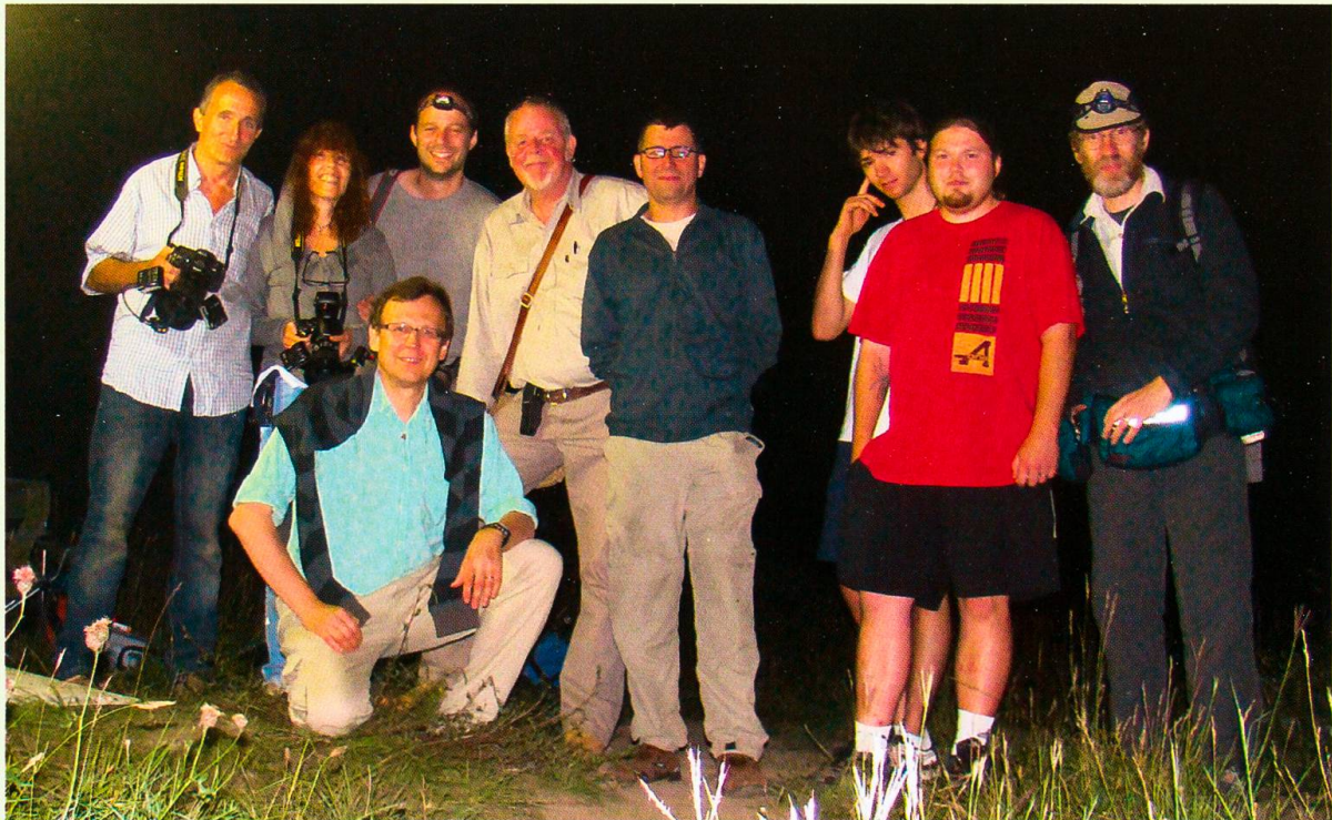
Chasse de nuit dans le canton de Genève (Les Baillets, vallon de l'Allondon, 27 juin 2011) pour les recensements des macrolépidoptères nocturnes (projet ELPENOR), microlépidoptères et coléoptères.