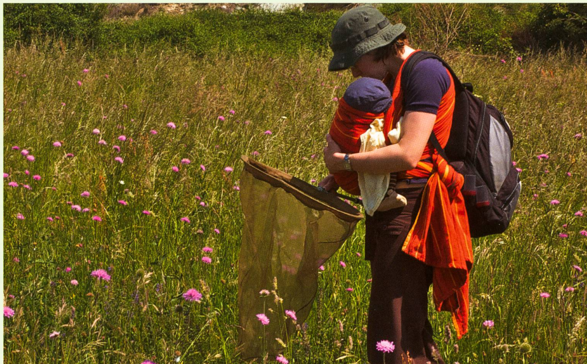
Excursion au Val d'Aoste en mai 2011. Il n'y a pas d'âge pour étudier les papillons, surtout quand on a une maman passionnée!