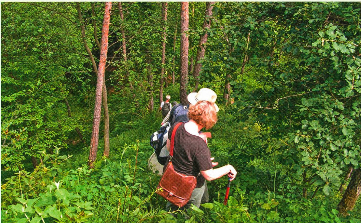
Immenberg: Steiler Abstieg zur Risi.

Mitgliederbestand: 34 Aktive, 6 Passive (Ende 2011)