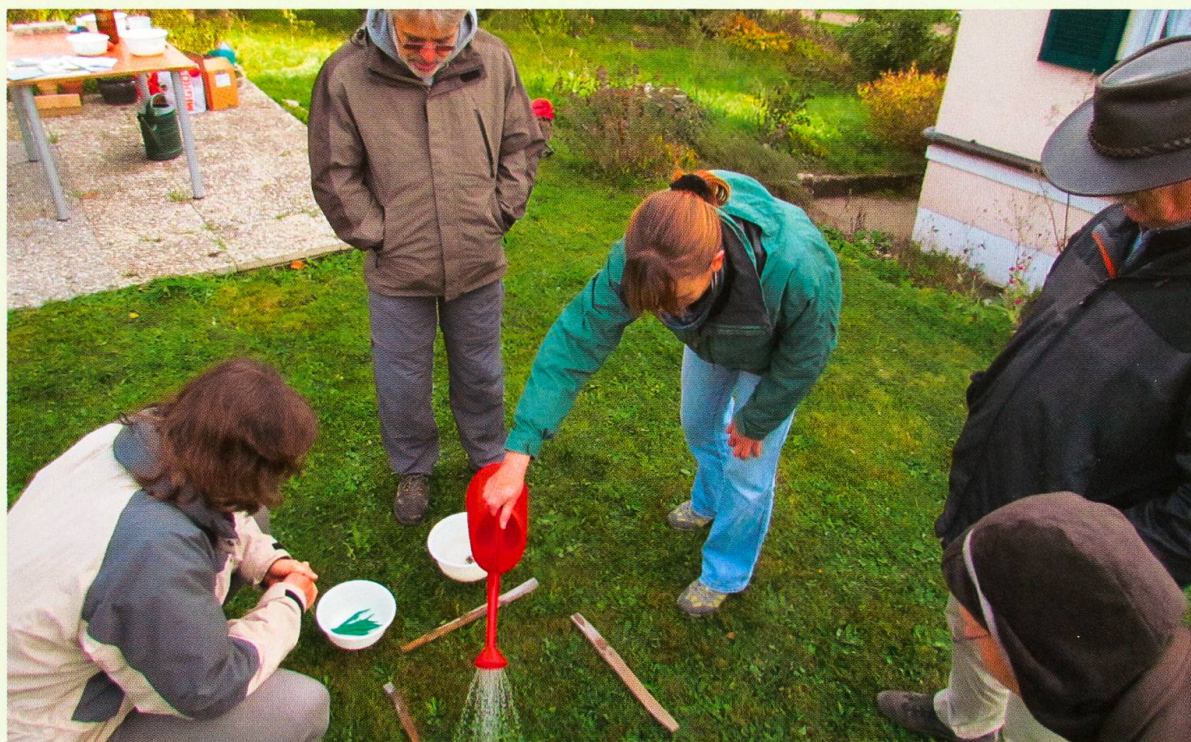
Pour débusquer les vers-de-terre, il suffit d'arroser la pelouse avec de l'eau additionnée de farine de moutarde. Après quelques minutes, la récolte peut commencer.