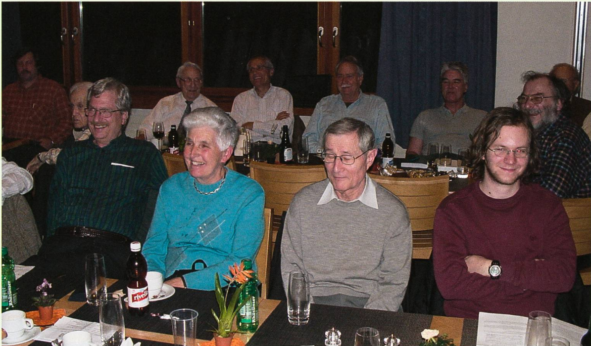
Abb. 1. Für unsere Generalversammlung brauchen wir jedes Jahr etwas mehr Platz. Erfreulich ist die gute Durchmischung von Jung und Alt. Der Einstieg ins 2. Jahrhundert ist für die Zürcher Entomologen von guten Vorzeichen begleitet.