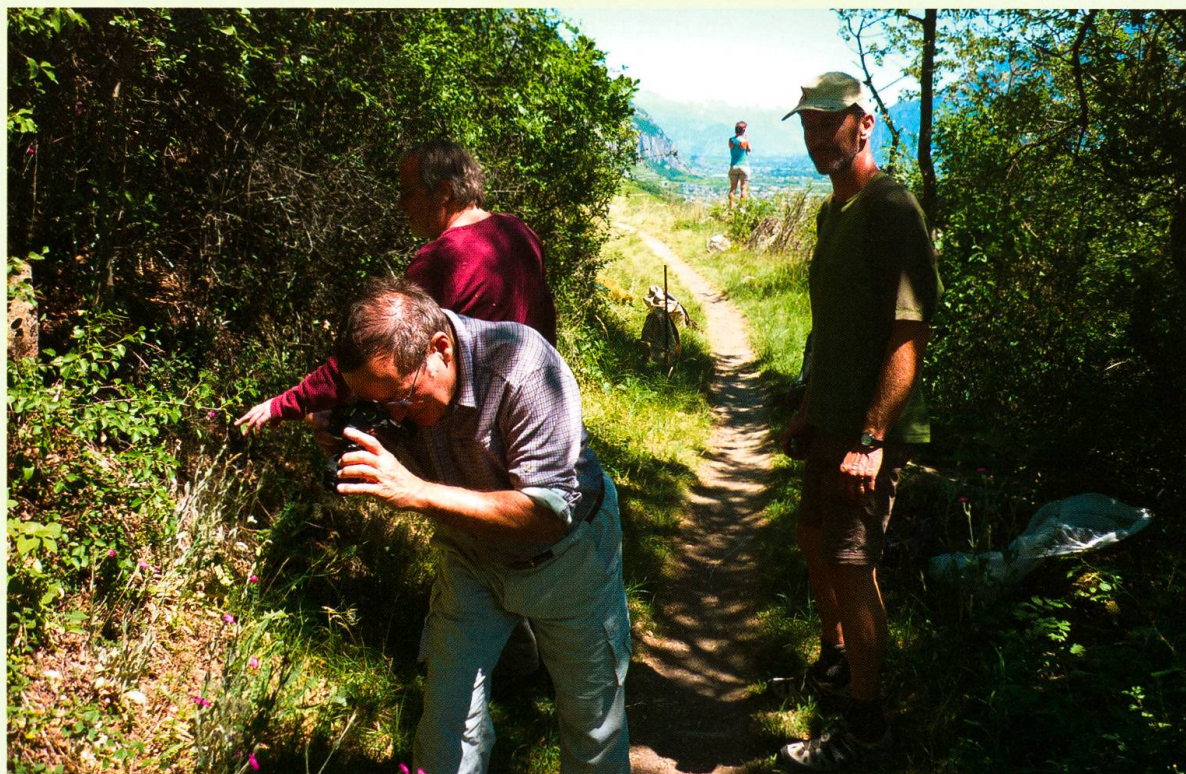
Excursion en mai aux Follatères (VS).