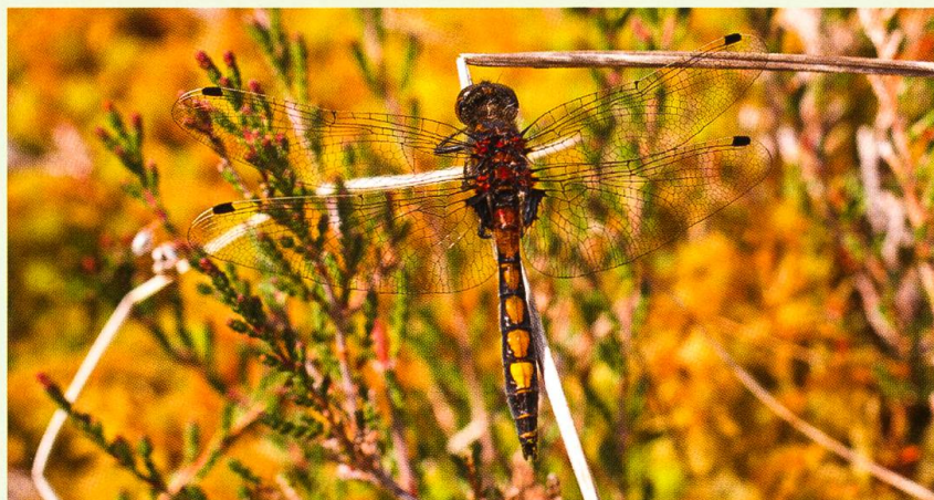
Leucorrhinia pectoralis (NE, La Brévine).