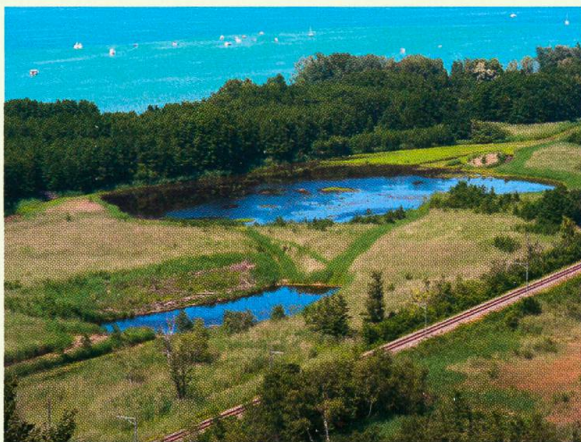
Abb. 3. Neu geschaffene Gewässer in der Grande Cariçaie am Neuenburgersee zwischen Châbles und Cheyres.

Die Exkursion vom 10. September 2011 führte in das Tal von La Brévine im Neuenburger Jura, wo in Höhenlagen über 1000 m Restflächen der einst ausgedehnten Hochmoore regeneriert werden. An den Beispielen der Gebiete Les Saignes-Jeanne und Le Marais bei Le Cerneux-Péquignot sowie Marais Rouges bei Les Ponts-de-Martel erklärte Sébastien Tschanz, Leiter der Projekte im Auftrag des Kantons, wie bei der Regeneration vorgegangen wird. Wichtigstes Ziel der Vorhaben ist, den Grundwasserstand zu heben und nährstoffreiches Wasser vom Torfkörper abzuhalten. Dabei werden die alten Entwässerungsgräben mit Sägemehl und feinen Holzschnitzeln verfüllt, womit sich das Wasser wieder aufstaut. Erfolge haben sich bereits eingestellt. In den Mooren von Le Cerneux-Péquignot sind neue mesotrophe Gewässer entstanden, in denen sich unter mehreren Libellenarten auch die Grosse Moosjungfer Leucorrhinia pectoralis (Charpentier, 1825) angesiedelt hat. Exuvienfunde belegen, dass sich die schweizweit seltene Moorart hier nun fortpflanzt. An anderer Stelle haben sich im einst abgetrockneten, kürzlich stark ausgelichteten Hochmoorwald zwischen den nun