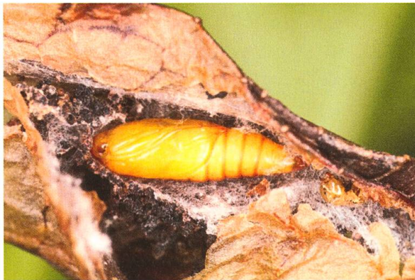
Abb. 4. Puppe.