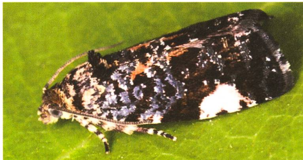
Abb. 5. Frisch geschlüpfte Argyroplote externa .

Die gesamte Raupenentwicklung erfolgt im selben Blatt (Abb. 1, 2); dort findet auch die Verpuppung statt (Abb. 4). Die Falter schlüpfen im Verlaufe des Monats Mai (Abb. 5).