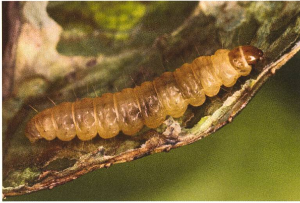
Abb. 3. Erwachsene Raupe.