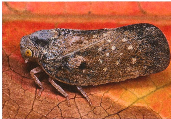
Abb. 2. Adulte Bläulingszikade Metcalfa pruinosa , Steiermark, 3.8.2007.