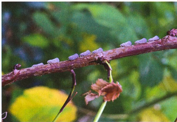
Abb. 1. Erstnachweis der Bläulingszikade Metcalfa pruinosa (Say, 1830) in Deutschland (Mutterstadt, 28.7.2012).