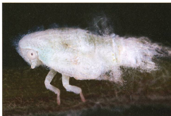
Abb. 4. Larve der Bläulingszikade Metcalfa pruinosa (Say, 1830), Steiermark, 12.8.2007.

war bereits nach wenigen Jahren ersichtlich, dass die Art nicht nur ein enormes Potenzial zur Massenvermehrung und Ausbreitung aufweist, sondern auch zur Schädigung der verschiedenartigsten Kulturpflanzen.