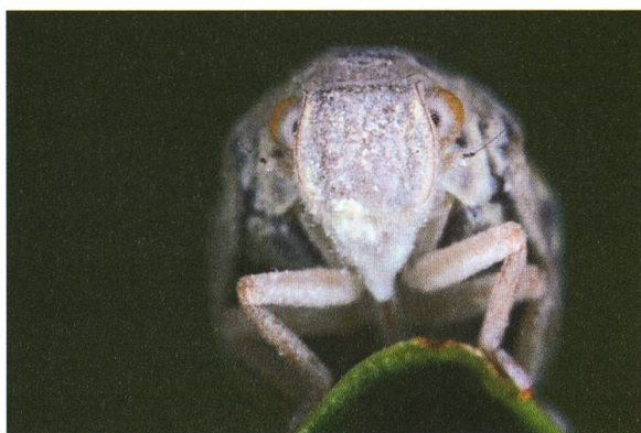
Abb. 3. Porträt desselben Individuums wie auf Abb. 2.