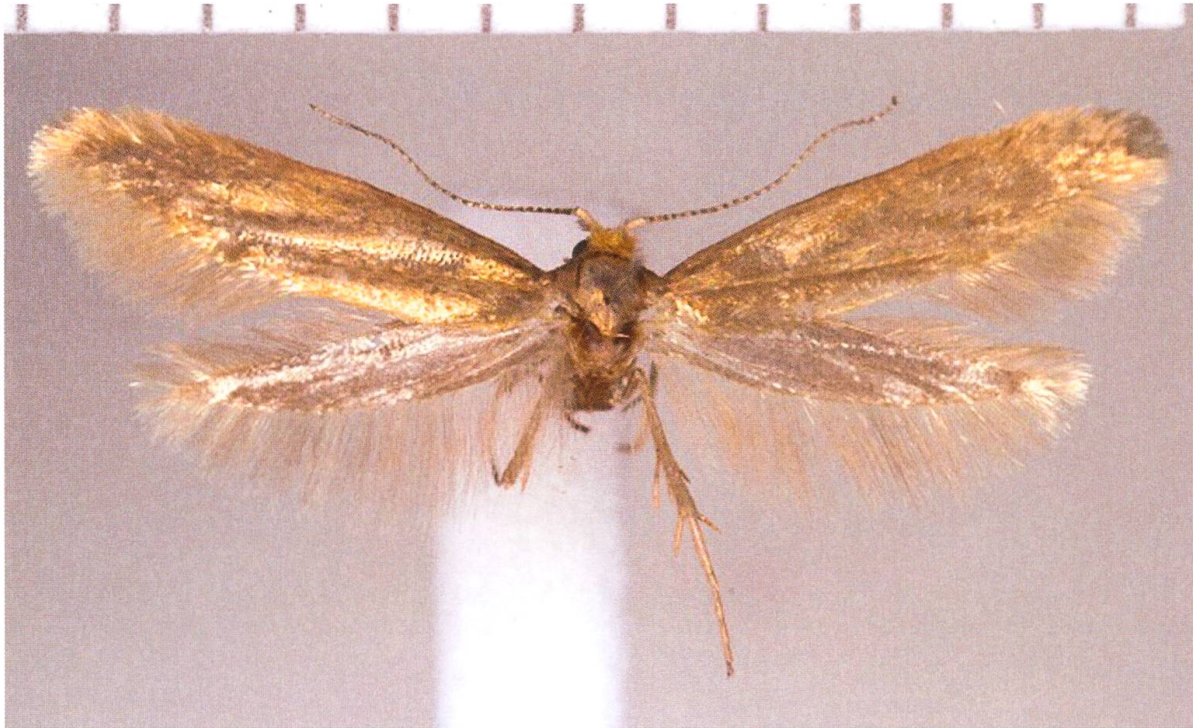
Abb. 1. Argyresthia svenssoni , Ilanz/Glion.