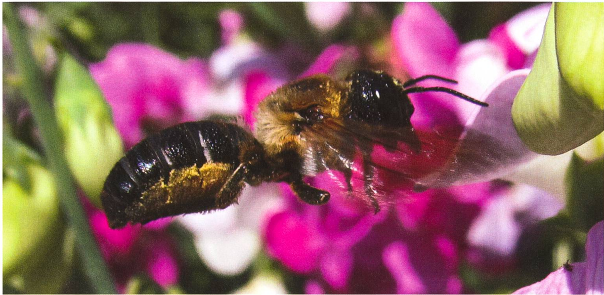
Abb. 2. Asiatische Mörtelbiene Megachile sculpturalis Smith, 1853 im Anflug auf eine Gartenwicke ( Lathyrus sp.) am 15.7.2015.

( Lathyrus sp.) neben den zahlreichen Platterbsen-Mörtelbienen Megachile ericetorum Lepeletier, 1841, Hummeln und Honigbienen eine enorm grosse (>2 cm), mir unbekannte Blattschneiderbiene ( Megachile ) aufgefallen (Abb. 1 und 2). Ich konnte das Tier beim Blütenbesuch mehrmals fotografieren und am 12.7. einfangen und wieder freilassen. An mehreren Tagen (11., 12. und 13.7.2015) war jeweils ein Tier an den Gartenwicken zu beobachten. Am 15. und 18.7. waren an den Blüten der auf ca. sieben Meter Länge den Maschendrahtzaun überwuchernden Gartenwicken sogar bis zu drei sammelnde Exemplare gleichzeitig anwesend. Dazu gesellten sich noch einzelne Blauschwarze Holzbienen Xylocopa violacea (Linnaeus, 1758) (Abb. 4).