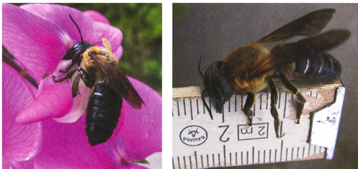
Abb. 1. In Altdorf (UR) an Gartenwicken gefundene (links) ca. 2.2 cm grosse (rechts) Megachile sculpturalis Smith, 1853.

Beim Fotografieren von Wildbienen im Garten in Altdorf (UR) (691735/192822; 473 m ü. M.) ist mir am 11.7.2015 an Gartenwicken oder Duftenden Platterbsen