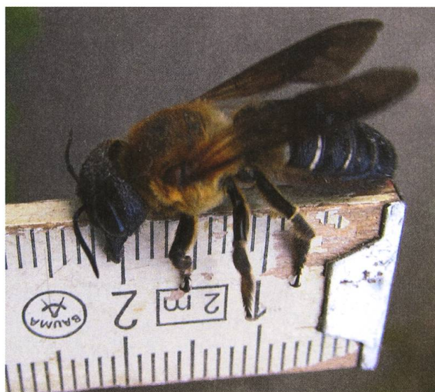
Abb. 1. In Altdorf (UR) an Gartenwicken gefundene (links) ca. 2.2 cm grosse (rechts) Megachile sculpturalis Smith, 1853.