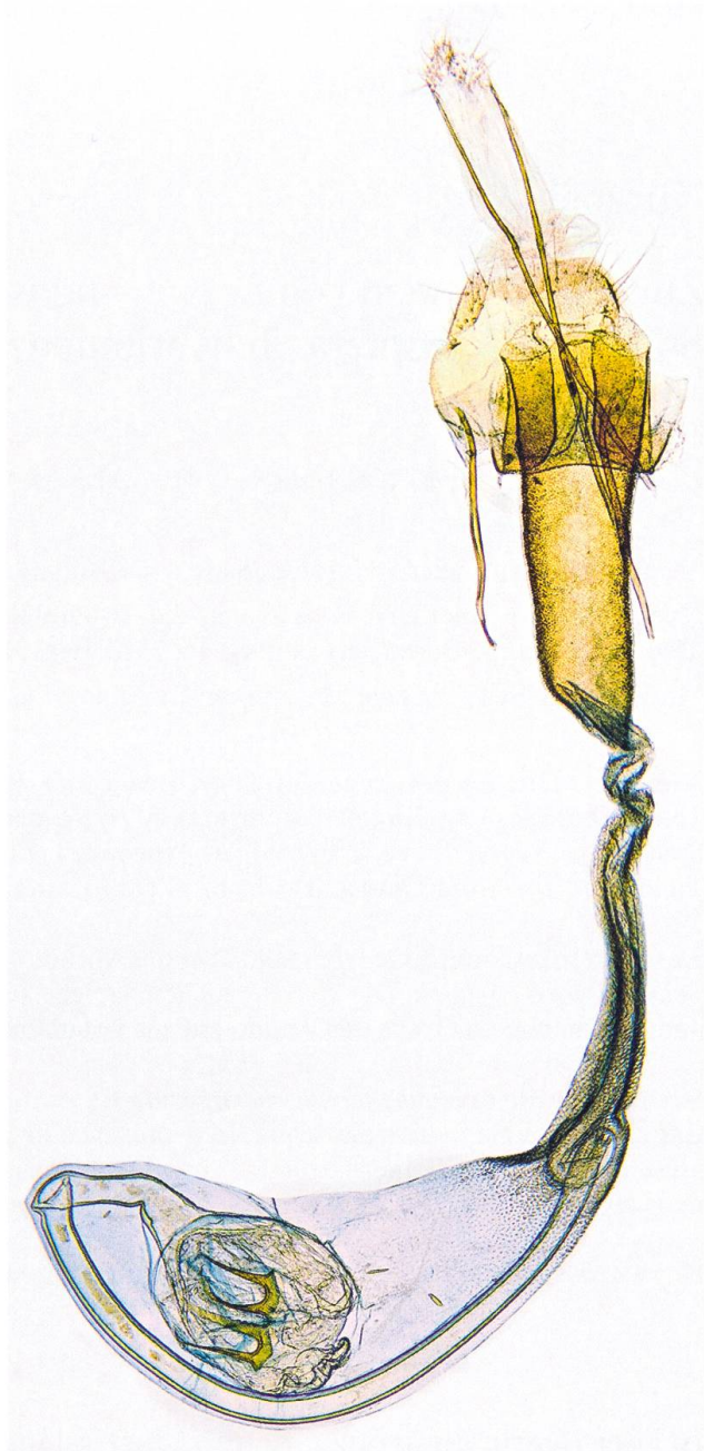
Abb. 3. Weiblicher Genitalapparat von Carposina berberidella mit der Signa (links unten) und dem Bursahals und Ostium (oben).